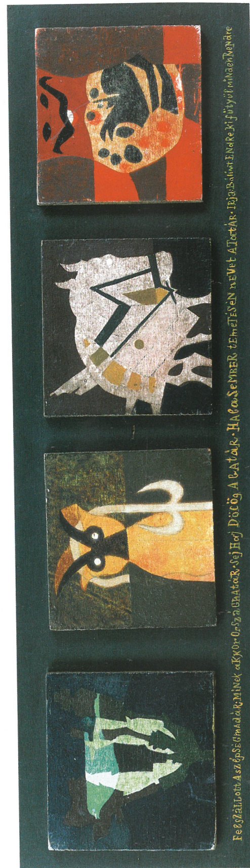
Felszállott a szépségmadár. Minek akkor országhatár. Sej haj döcög a batár. Halasember temetésén nevet a tatár. Írja Bálint Endre ki fűtyül minden rendre