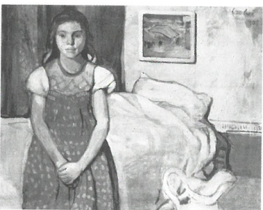
Czóbel Béla: Kislány ágy előtt , 1905. (olaj, vászon, 90 x 150 cm, magántulajdon)