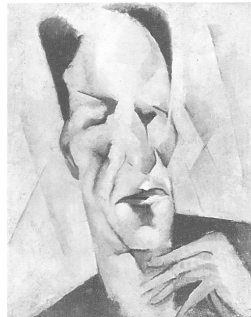
Kádár Béla: Önarckép 1920 körül

Az Önarckép vonalvezetése és a kontrasztos folthatások ritmusjátéka Rippl-Rónai József hagyományát követi, azonban az expresszív arc az élet viharairól árulkodik. A sárgás-fehér háttérből a kalap és a fehér ingre húzott kabát sötét foltjai emelik ki az okkerekéből és a vörös árnyalataiból festett arcot, melynek plasztikus formáit a száj, az orr és a szemek fekete kontúrja hangsúlyozza. A komor földszínekből festett önarcképet a szomorúság fátylaként járja át az erős arccsont-ra vetülő árnyék. Az érzékeny hangvételi festményt formai tömörsége és biztonságos szerkezete teszi harmonikussá.