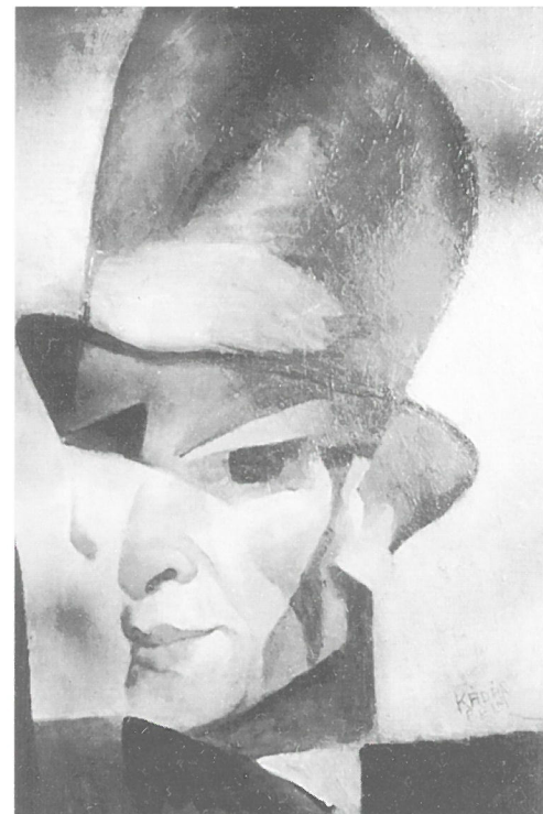
Kádár Béla: Önarckép 1920 körül