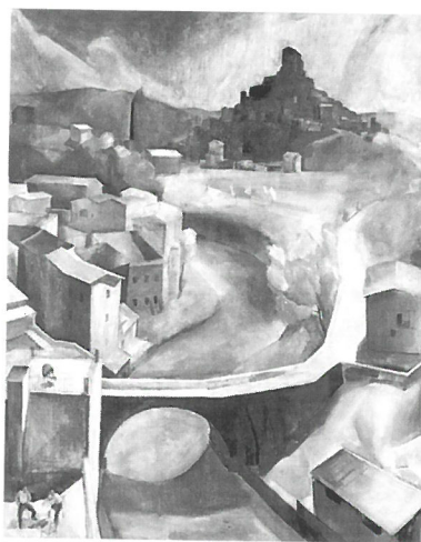
Patkó Károly: Subiaco, 1930. Tempera, olaj, vászon, 179x143,5 cm (MKB gyűjtemény)