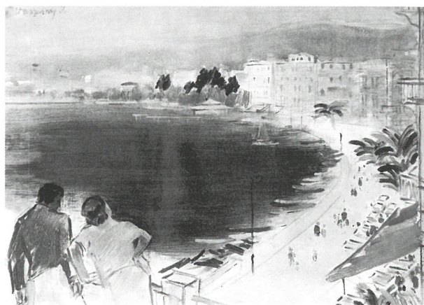
Vaszary János: Rapallói öböl, 1930-as évek, magántulajdon