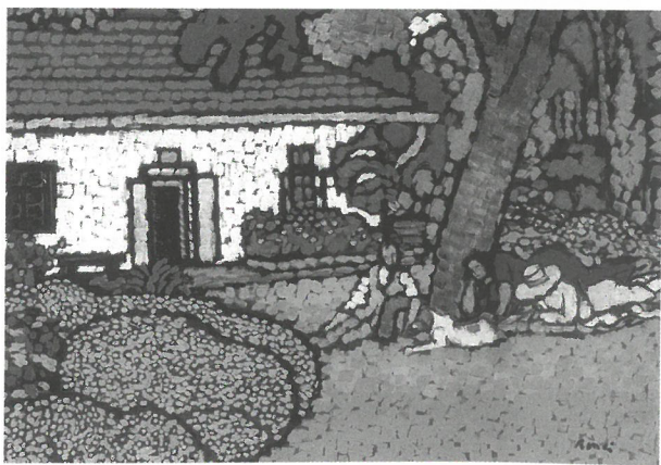
Piknik a Róma-Villa kertjében (A műterem előtt heverésző alakok), 1914–1915, magántulajdon