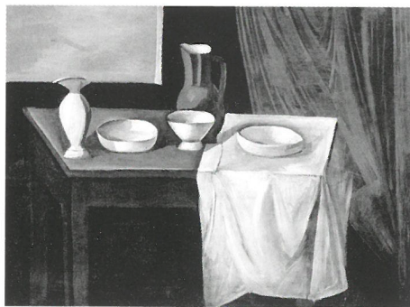
André Derain: Az asztal, 1911 Egyesült Államok, magántulajdon

Csendélet szoborral és gyümölcsökkel, 1911-1912