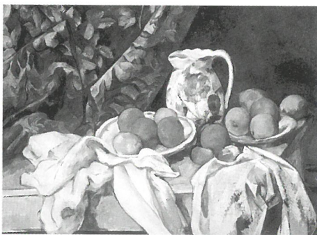
Paul Cézanne: Függöny, kanesó és tálak gyümölcsökkel, 1898-99, Ermitázs, Leningrád