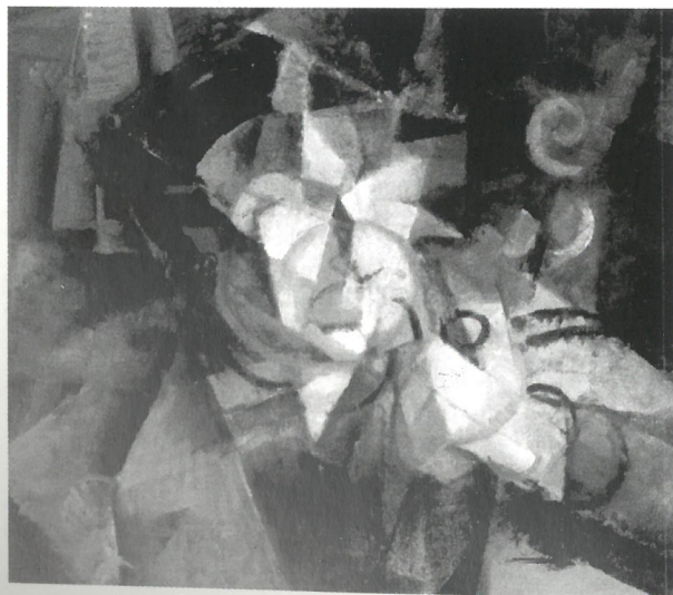
Pipázó férfi, 1913–1914, Janus Pannonius Múzeum, Pécs

Kikiáltási ár: 12 000 000 Ft / 48 780 EUR