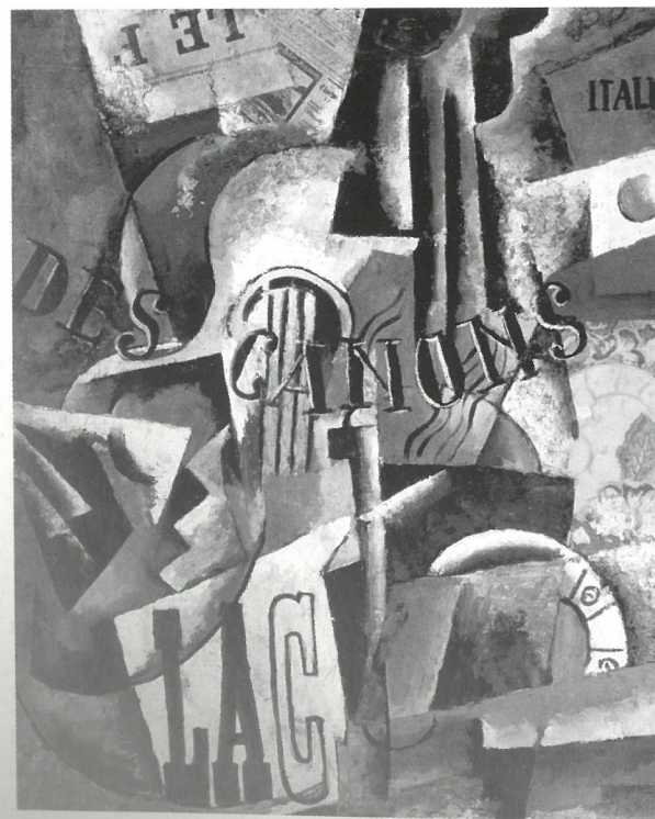
Ljubov Popova: Itáliai csendélet, 1914, Tretyakov Képtár, Moszkva