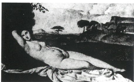
Patkó Károly: Fekvő akt (Giorgione után), 1922. Magyar Nemzeti Galéria, Budapest