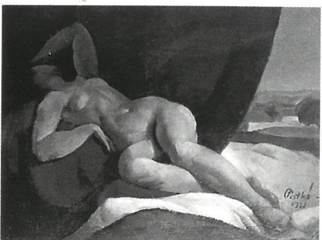
Patkó Károly: Fekvő akt (Tanulmány a Siestához), 1921. Magántulajdon