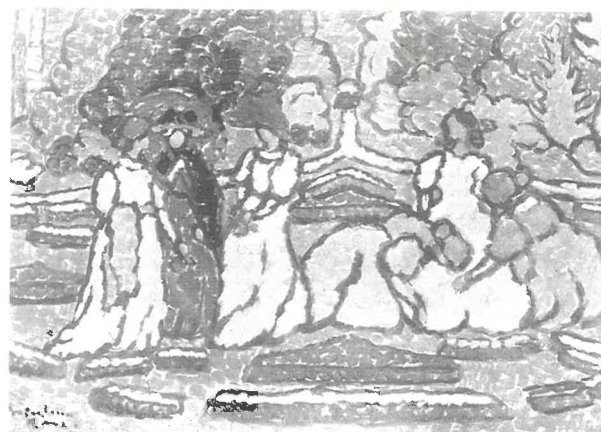
Rippl-Rónai József: Gobelin-ek készített olajfestésű terv

stílusát, mely 1907-8-tól lesz egyre inkább jellemző képeire, az életöröm és a céltudatos magabiztosság hatja át. Stílusára az ún. "pöttyös" technika a jellemző, tehát a kép felületét aránylag nagyméretű, izgatottan vibráló pöttyök borítják, a formákat kontúrok szakítják ki környezetükből. A pöttyözési eljárás leginkább a francia Fauves művészcsoporthoz tartozik, melynek tevékenységében találja meg előzményét, Rippl-Rónai újra csak a legmodernebb nyugat-európai törekvésekkel van szinkronban. Fontos jellegzetessége e képen is teljes pompájában kibontakozó stílusának, hogy nem keveri a színeket, - ő ezt az eljárást a "színtüzesítés parancsának" nevezi - a tiszta színek teljes intenzitásukban, de mondhatjuk úgy is, brutalitásukban jelennek meg. Ezek az átütő színek mégis kordában tartottak, a kontúrozás szellemesen