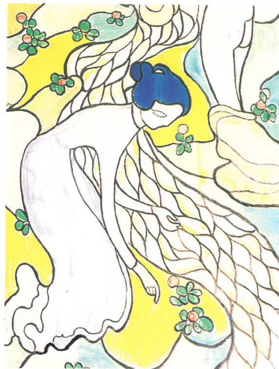
Maurice Denis: Asszonyok a pataknál 1894 Üvegablakterv

Nem véletlen, hogy Rippl-Rónai úgy érezte, hogy stílusa megérett a nagyobb, dekoratív feladatok beteljesítésére. Új