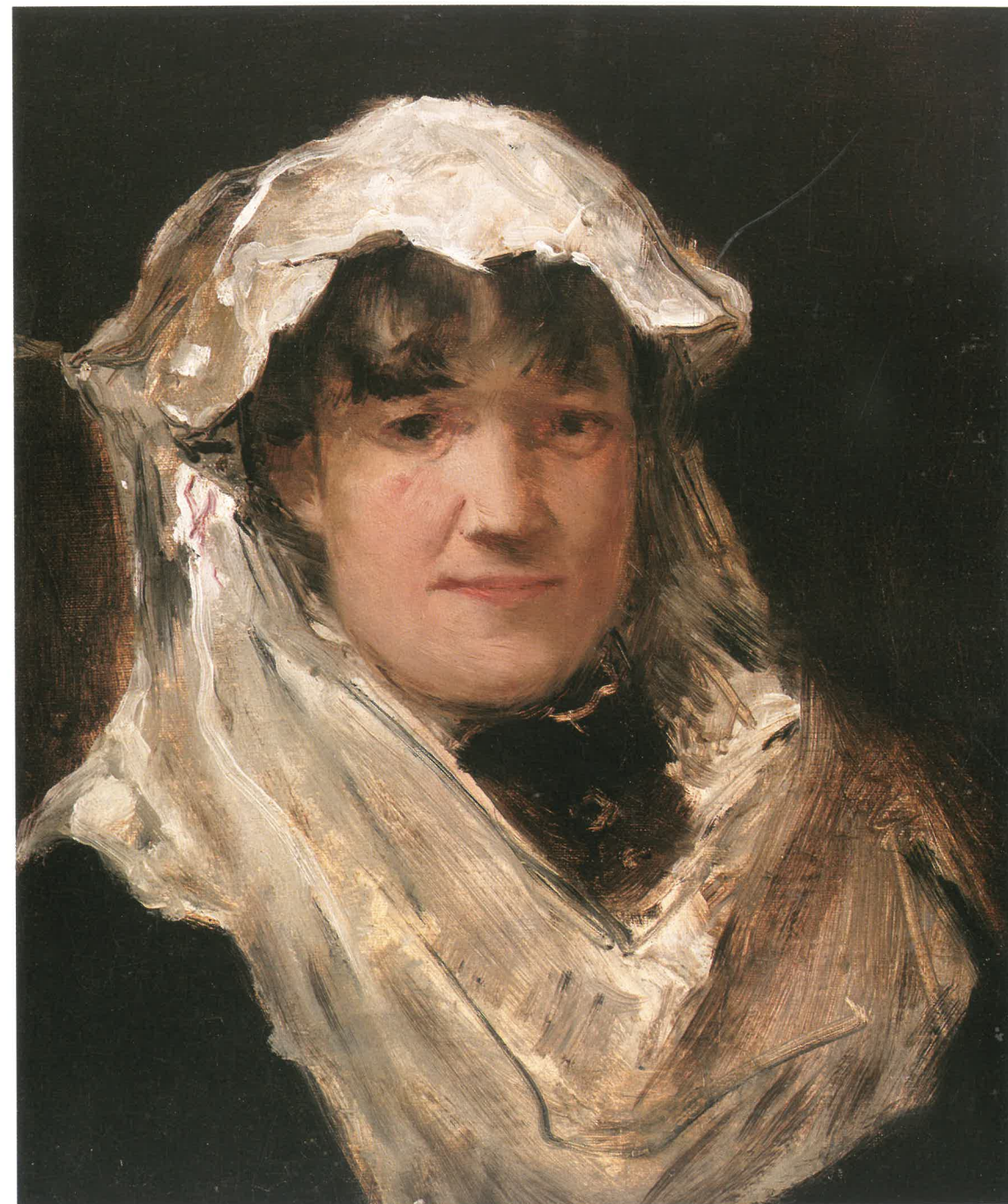
67. ▲ Munkácsy Mihály (1844-1900)