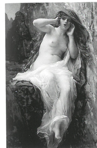
Alexandre Cabanel: Visszhang, 1874