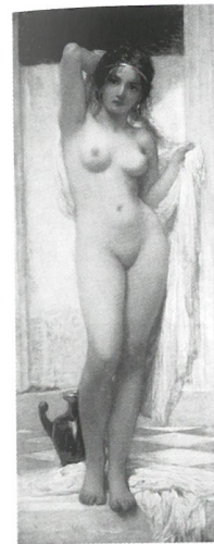
Lotz Károly: Fürdő nő, 1901, Magyar Nemzeti Galéria