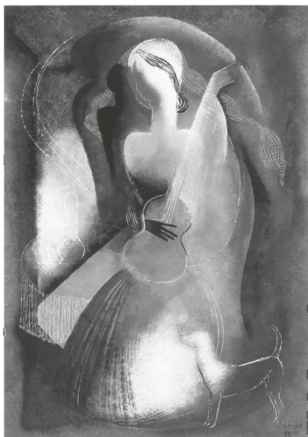
Kádár Béla: Nő gitárral, 1930-as évek eleje, magántulajdon