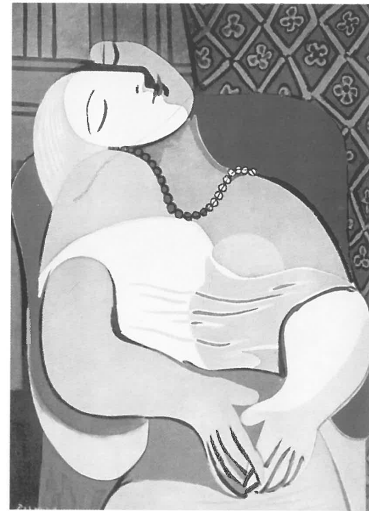
Pablo Picasso: Az álmodó, 1932.

Kádár festészete nem a hagyományos értelemben vett elbeszélő jellegű festészet. Az 1930-as években készült képei szinte teljes egészében mellőzik a hagyományos értelemben vett „történetet”. A festő allegóriákban, szimbólumokban, ritmusban és formákban fogalmazza meg cseppet sem irodalmias mondanóját. „A kép tárgyak ábrázolásával gondolattársít, szimbolizál, allegorizál ... , hogy végső fokon törhetetlenül egységes legyen harmóniában, ritmusban, színben, vonalban, kifejezésben és tartalomban.” – vélekedik ekkortájt Kádár saját képeiről. Festményei újra és újra az önmaguk teremtette vizuális nyelvezeten keresztül idézik meg az eszményt, melyet önéletrajzi írásában így fogalmazott meg: „több legyen, mint valóság, messze a valóság felett, minden földi szennytől mentes valami: a mennyei beteljesedés”.