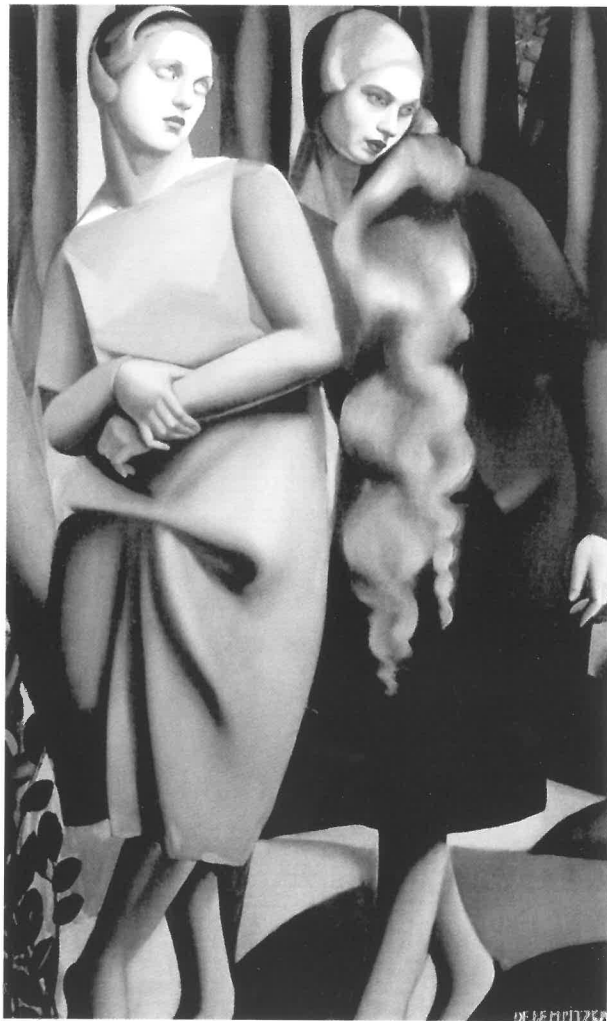
Tamara de Lempicka: Kettős portré, 1925.

A háború utáni képzőművészet és vizuális gondolkodás elsősorban a lokálok színpadairól ismert jazz-zenészeket keresztül idézte meg a távoli kultúrák misztikus világát. Az afrikai „primitív” művészet gazdag formakincsét a festők és grafikusok az egzotikus motívumok pikáns, néhol már túlzó módon történő érzékeltetésével emelték át az európai tradíciók közegébe. Afrika ősi kultúrája ekkor még egyáltalán nem számított szélesebb körben elterjedt jelenségnek; s főként nem elfogadott értéknek. A Scheiber Hugó képeiről ismert jazz-zenészek tüzes, új, minden eddiginél merészebb zenei világa még a harmincas évek végén is skandalumnak számítottak a tradicionális európai komolyzene világában. A táncos mulatók és éjszakai revük forró levegője, a mozivásznakról és a filmplakátokról ismert teátrális, sok esetben frivol gesztusok azonban a „magas művészet” szféráját sem hagyják érintetlenül. Akárcsak Európa komolyzenei koncerttermeibe, a mindennapokba is lassan-lassan beszivárgott az afrikai művészet motívumkincse, mígnem a hétköznapi vizuális kultúra részévé vált. Kádár Béla különleges szépségű asszonyai is ebből a milióból születtek. Míg az 1920-as években a népi motívumok és a mesék világa szolgáltatott elapadhatatlan forrást, addig egy évtized múlva az afrikai primitív művészet vált legalább ilyen nélkülözhetetlen forrásvidékévé a Kádár-képeknek.