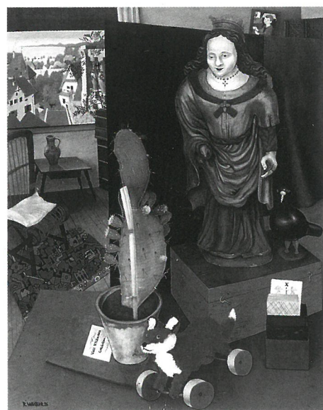
Rudolf Wachter: Csendélet kaktusszal és szentfigurával, 1926, magántulajdon