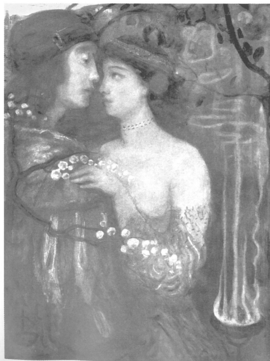
Gulácsy Lajos: A varázsló kertje , magántulajdon