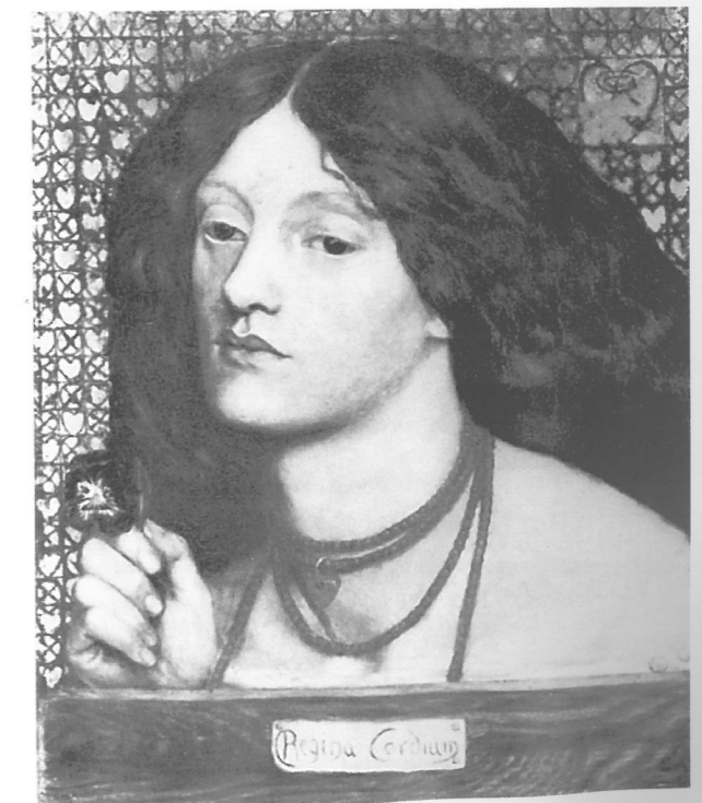
Dante Gabriel Rossetti: Regina Cordium , 1860, Johannesburg, Art Gallery