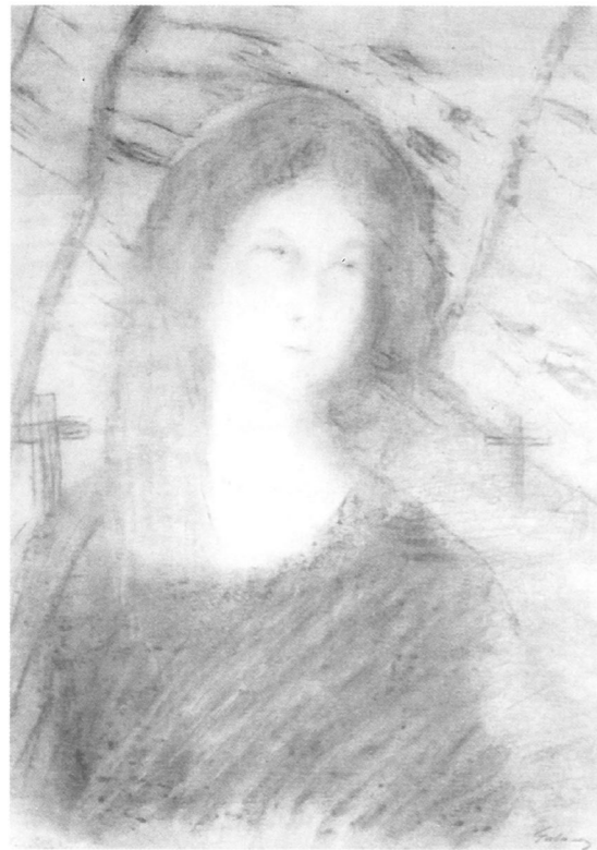
Gulácsy Lajos: Nő fejfák között , 1914 után, magántulajdon