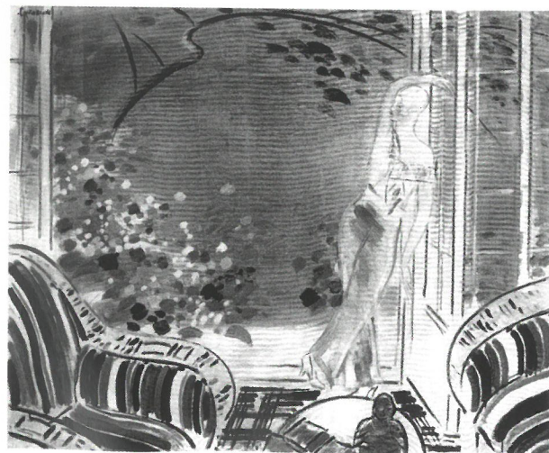
Vaszary János: Verandán álló nő, 1930-as évek Budapest, Magyar Nemzeti Galéria