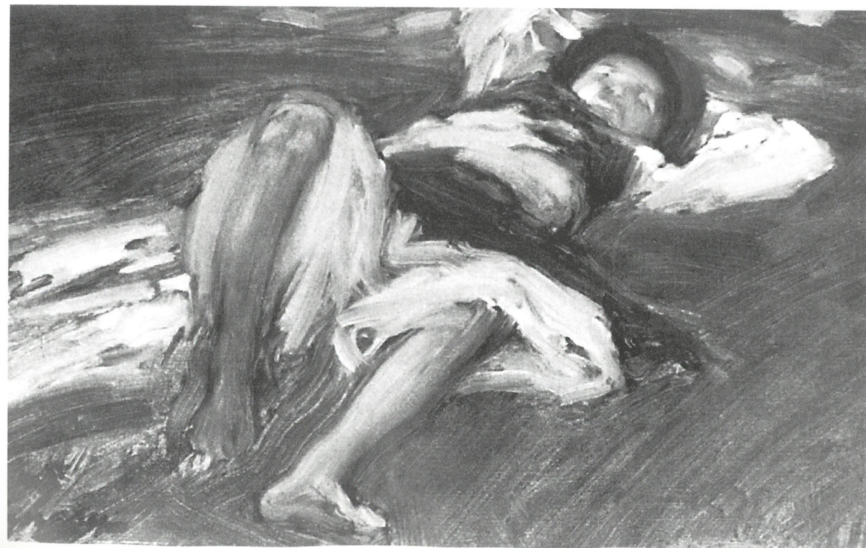
Vaszary János: Alvó parasztfiú , 1905, magántulajdon

zó kislányt ábrázol. Tavasz, fiatalság, üdeség és frissesség fogalmainak szó szerint színtiszta megnyilvánulása e festmény, mely fennen hirdeti Vaszary véleményét a festészetről és annak egyik alapvető feladatáról, a gyönyörködtetésről. Matisse pár évtizeddel korábbi szavai csendülnek vissza Vaszary kései színszimfóniájából, mely szerint: „Az én álmom egy olyan művészet, melyet egyensúly, tisztaság, nyugalom tölt be, melynek tárgya nem nyugtalanít, és sok figyelmet nem igényel, amely minden szellemileg elfoglalt egyénnek, épp úgy a kereskedőnek, mint a művésznek enyhülésül szolgál. Szóval: szellemileg megnyugtat, hasonlóan egy jó karosszékhez, mely a fizikai kimerülés számára nyújt üdülést.”