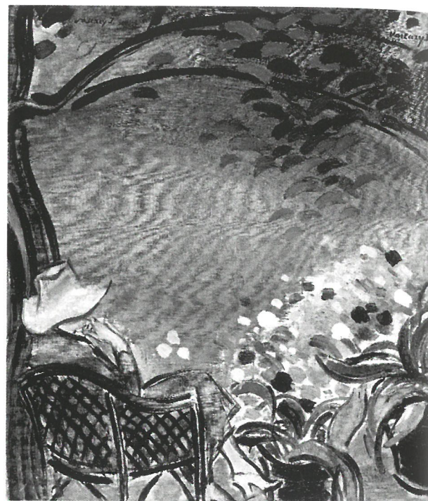
Vaszary János: Nő kertben, 1928 körül Budapest, Magyar Nemzeti Galéria

„Uraim, nyissák ki az ablakokat, hadd áradjon be friss levegő ebbe az országba!” – szólította fel Vaszary János egy alkalommal tanítványait, belépve az áporodott szagú epreskerti műterembe. A mester e frappáns paradoxonnal próbálta a fiataloknak megvilágítani szentül vallott hitét, mely szerint a lehető legszélesebb látókört igénylő, minden pozitív hatásra fogékony művészi magatartás és a hazaszeretet semmiképpen sem lehetnek egymást kizáró fogalmak. Az 1930-as évek Magyarországn az ilyen és ehhez hasonló gondolatok egyre erőteljesebb támadásnak voltak kitéve. Vaszary, aki még hetven körül is az életerő eleven megtestesülése volt, festészetével éppúgy, mint írásaiban, lankadatlan küzdelmet folytatott a Horthy-korszak konzervatív és a nemzeti értéket az ésszerűtlenség határát messze átlépve propagáló kultúrpolitikája ellen. A legjobb példával járva tanítványai előtt, vásznai egyre ropogósabb frissességgel hirdették a modern művészetben rejlő kimeríthetetlen lehetőségeket, kiállításain „a színek oly új árnyalatokban való gazdagságával bódított el, ami egyszerre virágoskertté avatta a falakat.”