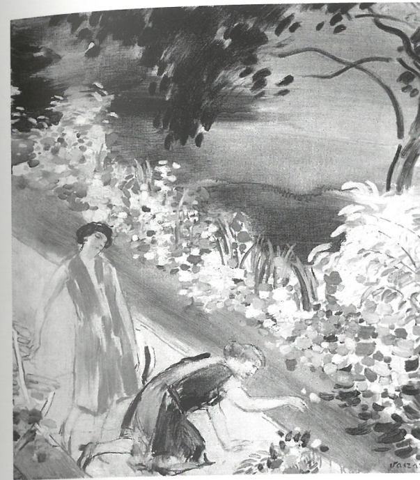
Vaszary János: Kertben (Virágot szedő nők) , 1937 körül magántulajdon