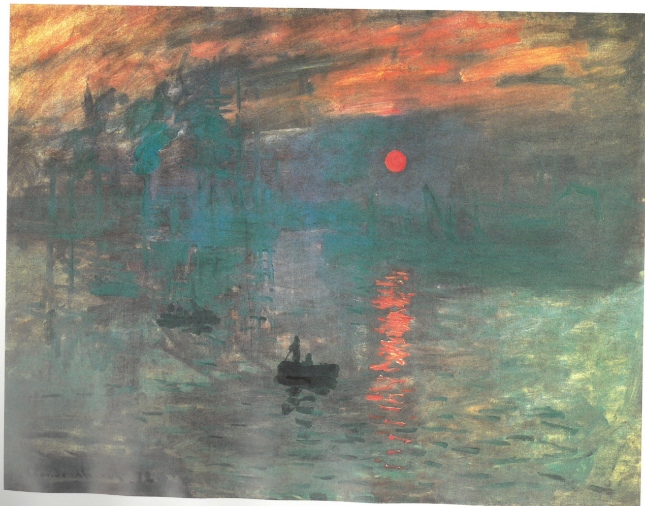
Claude Monet: Impresszió, a felkelő nap, 1872 Musée Marmottan, Párizs

Lassanként hivatalos elismerés is övezte művészetét, még becsületrendet is kapott. 1906-ban, a leköszönő August Renoir utódaként ki-nevezték a párizsi Salon d'Automne festészeti szekciójának vezetőjének. Ő az, aki az Őszi szalon keretein belül két korábbi, időközben elhunyt barátjának retrospektív kiállításait