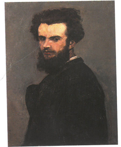
Armand Guillaumin: Önarckép, 1875. körül Musée d'Orsay, Párizs

Kikiáltási ár: 19 000 000 Ft Starting price: 79 167 EUR