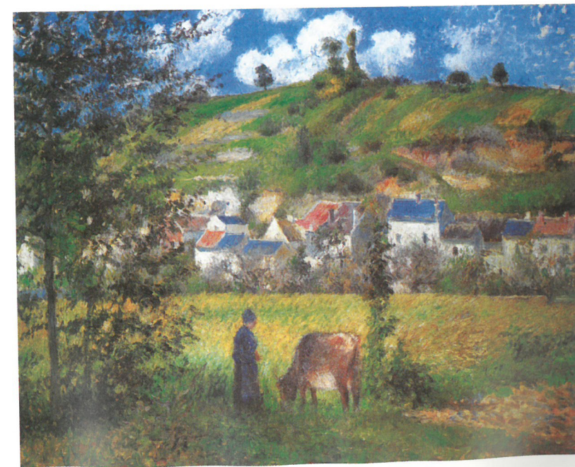
Camille Pissarro: Chaponvali táj, 1880 Musée d'Orsay, Párizs

ható. Az Orsay melletti kis települést, Damiette-et, Guillaumin 1882-ben fedezte fel magának, és az elkövetkezendő másfél évtizedben rendszeresen járt ide pleinair képeket festeni. Itteni festményeinek zöme 1884 és 1888 között keletkezett. A nagy közgyűjteményekben lévő damiette-i tájképek, mint az „Eső után”, az „Alkony Damiette-ben” vagy a „Damiette-i almafák” alapján jól ismerjük a tájat, és a festő ekkori stílusát. A most aukcióra kerülő műhöz még közvetlen analógia is rendelkezésünkre áll: a „Damiette, szénaboglyák és káposztaföld” című 1885 körülre datált olajkép. Guillaumin a két, méreteiben is hasonló művet szinte egyazon állásból festette, a kép kivágás is hasonló. Előterben a jellegzetes, enyhe szögben tört tör-