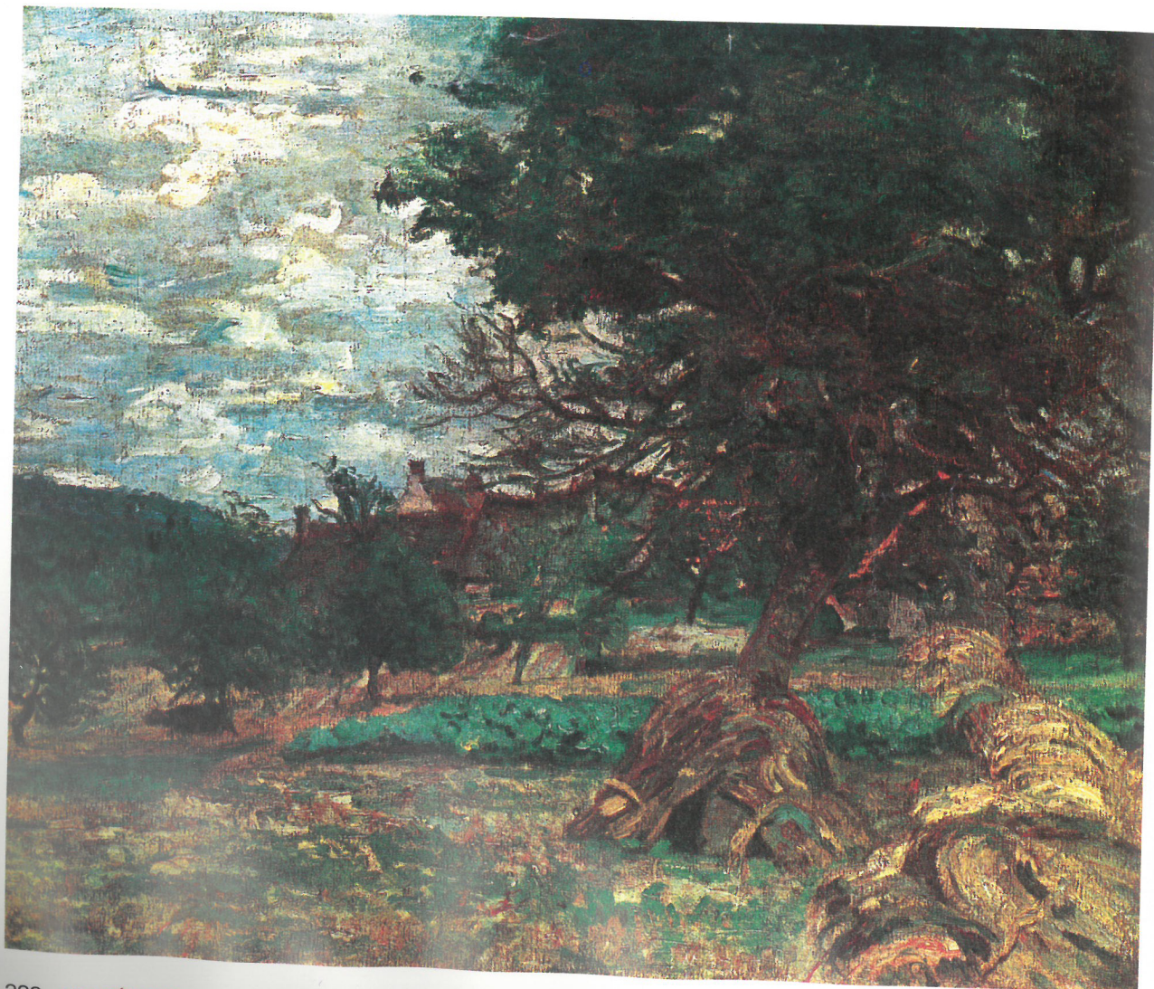
Armand Guillaumin: Damiette, szénaboglyák és káposztaföld, 1885 körül Magántulajdon