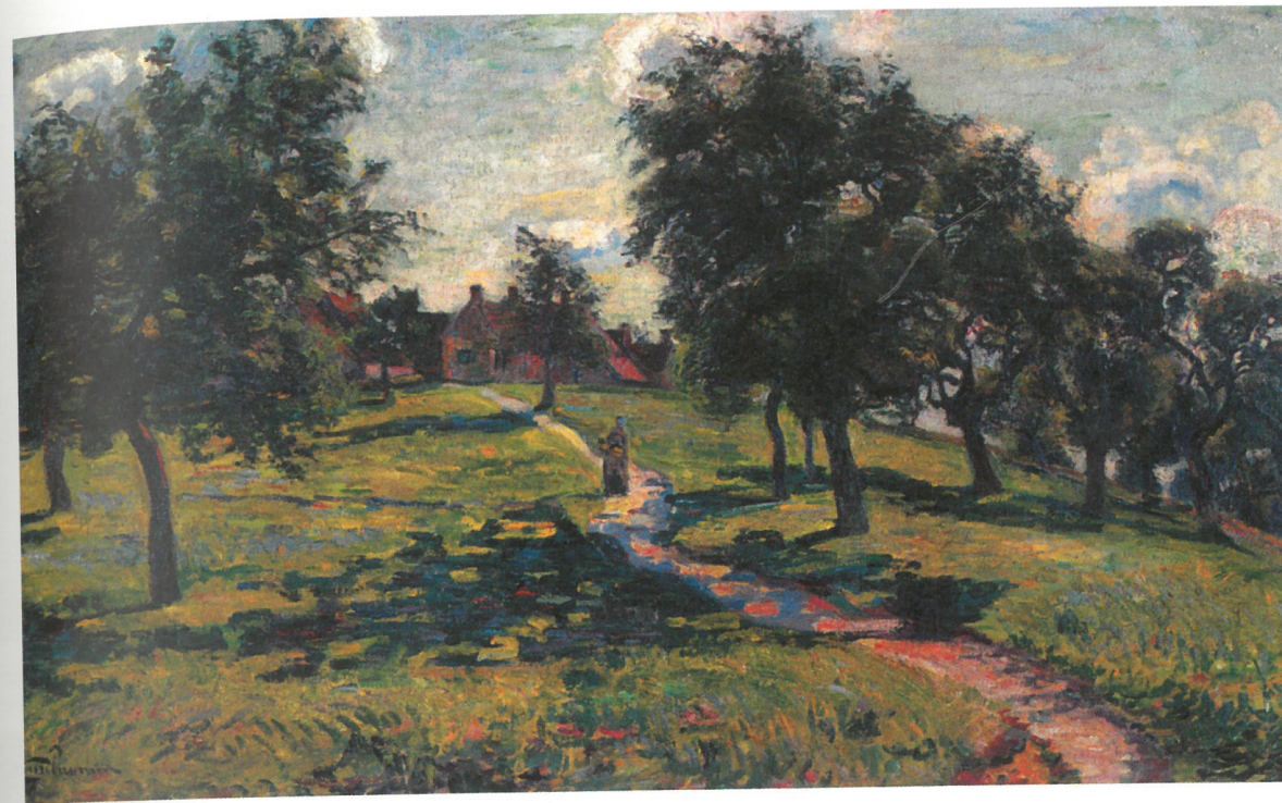
Armand Guillaumin: Damiette-i almafák, 1884 körül Musée d'Orsay, Párizs