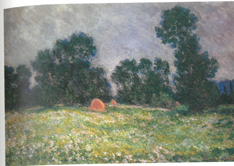
Claude Monet: Giverny mezők, 1891 Magántulajdon