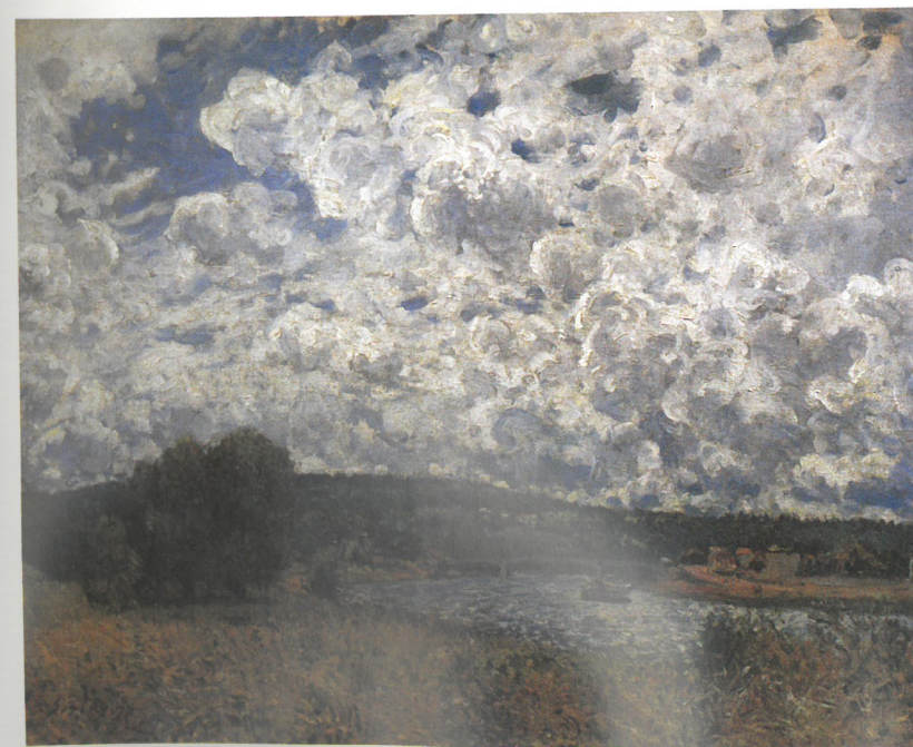
Alfred Sisley: A Szajna Suresnes-nél, 1877 Musée d'Orsay, Párizs