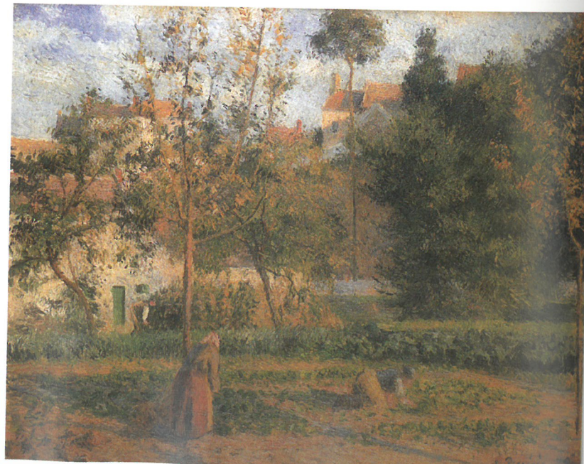
Camille Pissarro: Zöldségeskert Pontoise-ban, 1879 Musée d'Orsay, Párizs