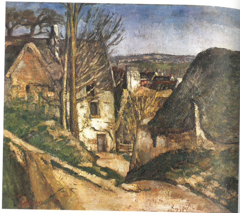
Paul Cézanne: Az akasztott ember háza, 1874 körül Musée d'Orsay, Párizs

Abban a szerencsés helyzetben vagyunk, hogy a festmény keletkezése mind térben, mind időben meglehetősen pontosan behatárol-