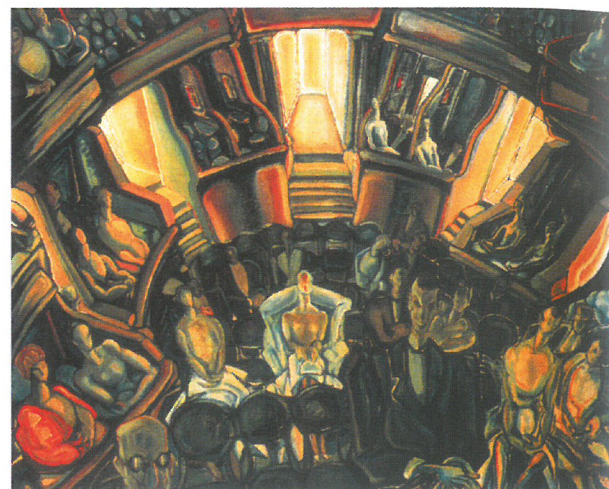
BATTHYÁNY Gyula: Orfeum, 1930-as évek, magántulajdon