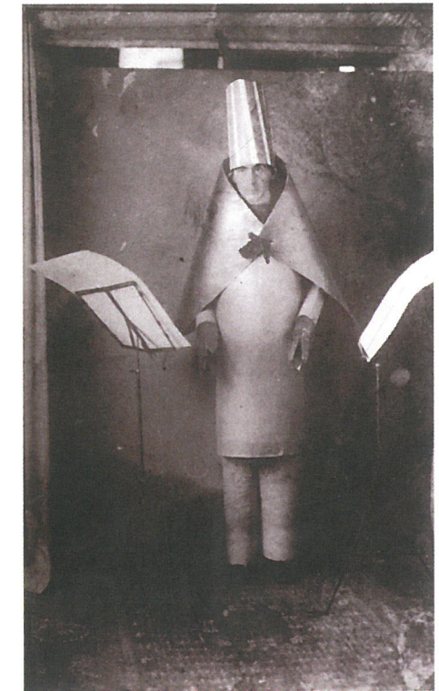
Hugo BALL a Cabaret Voltaire-ben (Zürich), 1916