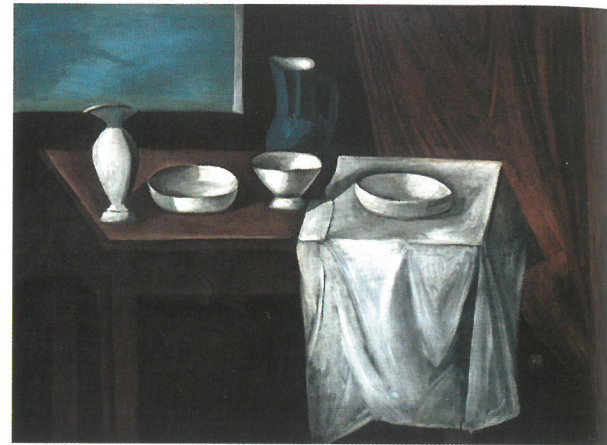
André DERAÏN: Az asztal, 1911., magántulajdon