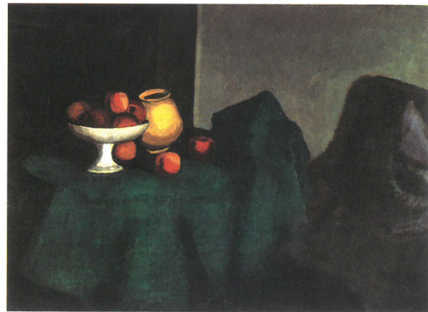
ORBÁN Dezső: Nagy csendélet, 1911. Australian National Gallery, Canberra