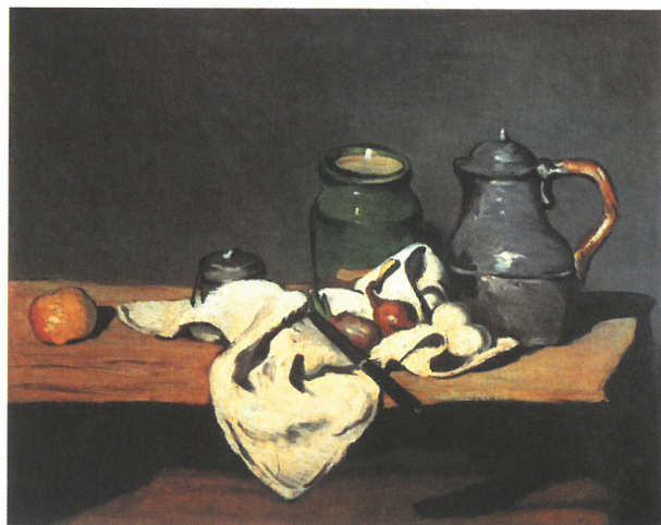
Paul CÉZANNE: Csupor, kávéskanna, gyümölcsök, 1869. Musée d'Orsay, Paris