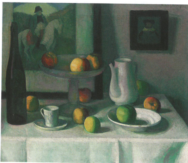
CZIGÁNY Dezső: Csendélet Napoleon-képpel, 1912-13 körül magántulajdon