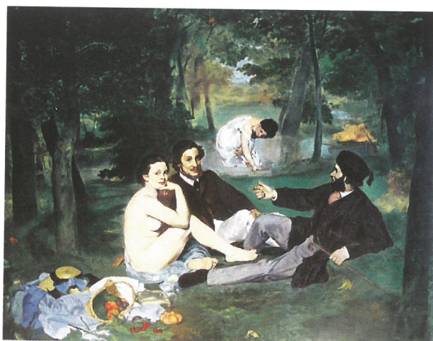
Edouard MANET: Reggeli a szabadban, 1863. Louvre, Párizs