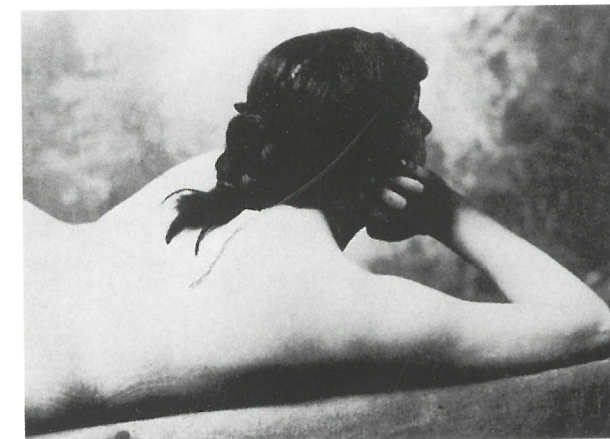
Fotótanulmány a Pacsirtához , 1882 körül