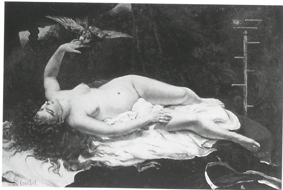
Gustave COURBET: Nő papagájjal, 1866. Metropolitan Museum of Art, New York

Szinyei és a korszak hazai nagymestereinek elképzelése a természet utáni „direct” ábrázolásról azonban sokban eltért a mai közvélekedéstől. Bár hallgatása után tájrészletei már egyértelműen a természetben készültek – „Szakítanom kellett régi eljárásommal, s neki ültem vásznammal ki, directe a természetnek; csak ez frissíthet fel, csak innen nyerhetek új erőt” zsánerfiguráihoz továbbra is tanulmányfotókat, vázlatokat használt, s alakjait rendszerint a táj befejezése után a műteremben festette fel a vászonra. Ez a gyakorlat egyáltalán nem volt szokatlan a korszak festői körében. Így dolgozott többek között Gustave Courbet is, aki bár festészetében a valóság csorbítatlan érvényre juttatására törekedett, mégsem látott kivetnivalót a fotó utáni műtermi munkában.