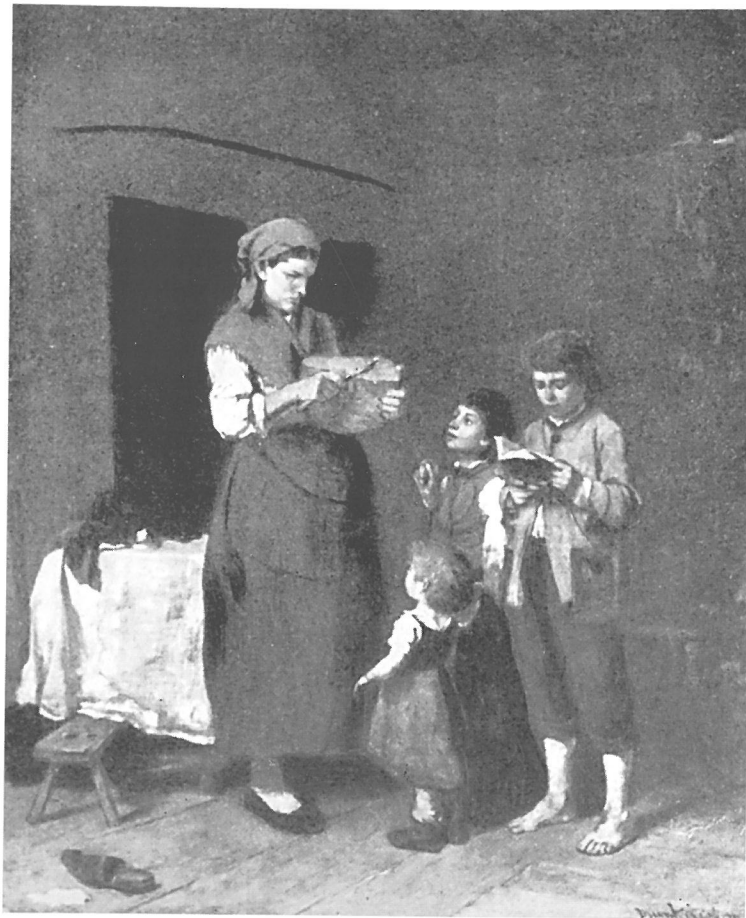
Munkácsy Mihály: Iskola előtt I. , 1871-72

klasszikus francia realista festészet hagyományához, főként Courbet műveivel kötődnek.