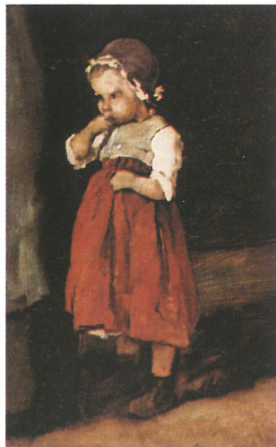
Munkácsy Mihály: Zálogház , 1874 (részlet)