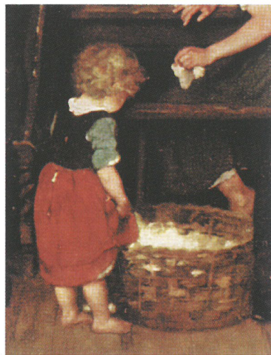
Munkácsy Mihály: Tépéscsináló , 1871 (részlet)