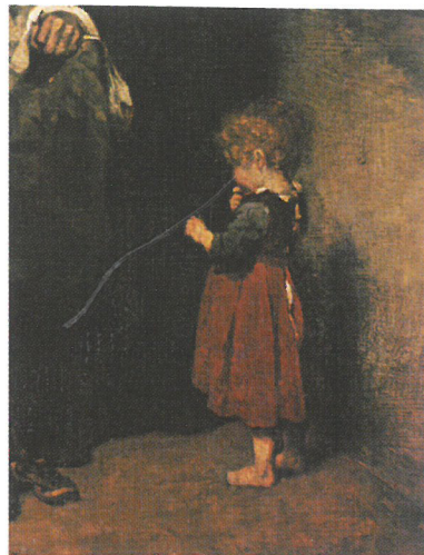
Munkácsy Mihály: Siralomház , 1869 (részlet)