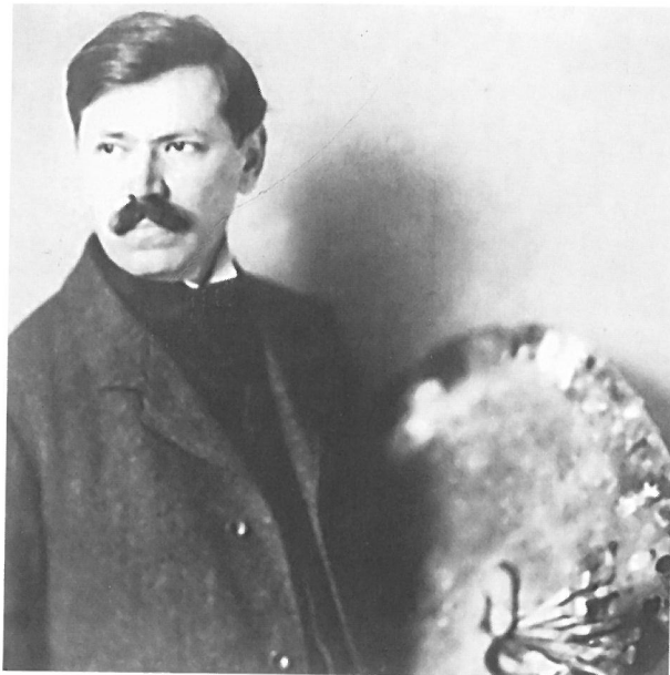
Vaszary János

Egy tavaszi napon Versailles parkjában kényelmesen sétáló társaságot láthatunk. A szokványos jelenetben mégis van valami különös, ami kiemeli a képet a hétköznapiságból. Szerencsére rendelkezésünkre áll a festmény alapjául szolgáló tusrajz-vázlat (MNG Grafikai osztály), mely a kulcsot adhatja a helyes értelmezéshez. A rajz minden valószínűséggel a helyszínen született, datálása szerint 1925. IV. 23-án. Pillanatnyi festői rögzítése a látványnak, pontosan abból a nézetből, ahonnan a festmény is készült. A részletek többnyire megegyeznek a festményével, szembetűnő különbséget az utóbbi javára az épület nagyobb távlatba történő helyezése, illetve az alakok feltűnése jelenti. A tágabb perspektíva alkalmazása lehetőséget adott a festmény alap-