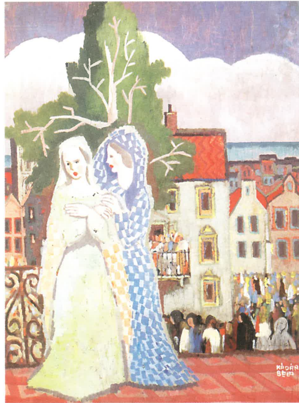
Kádár Béla: Két nő a téren, 1936 körül