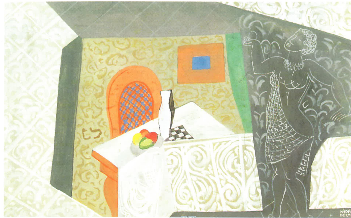
Kádár Béla: Intérieur női akttal, 1937 körül

A Lombok rejtekében Cézanne és Matisse párhuzamai felvetik Kádár Béla festészetében megjelenő franciás igazodás kérdését. A fiatal Kádár Béla, aki gyalog járta be Euró-