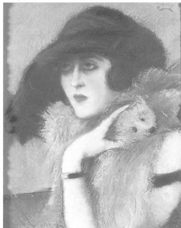
Rippl-Rónai József: Zorka boával

Tudomásom szerint Józsi bácsi egyetlen aktképet festett róla -