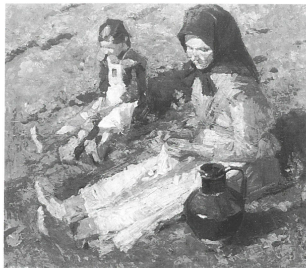
Fényes Adolf: Fűben, 1903 MNG. (1.kép)

A Vizet hozó leány és fiú Fényes 1903-06 közötti plein-air korszakához kapcsolható. A képciklusból már jól ismert ábrázoltak csoportjából most is csak egy-egy alakot választ. A letisztult megformálást emeli ki 1904-ben Fényes művé-