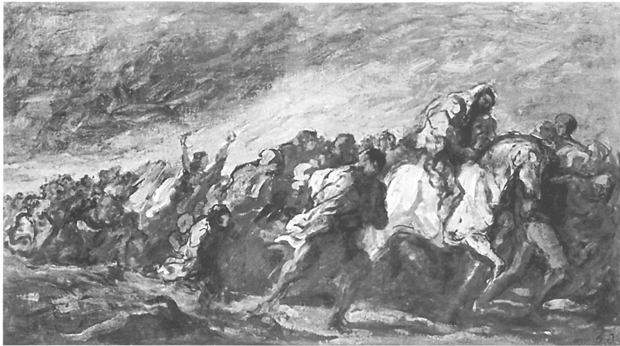
Daumier: Menekülők/Kivándorlók, 1868-70

nösnek látszik, hogy ilyes magamforma embert érhetne. Valami tévedés lehet a dologban.” (MNG Adattár 3396/1934/13) A háborút nem a hősiesség színhelyének fogta fel, sokkal inkább olyan szcénának, ahol azok az erők, melyeket a természet és az emberi természet tanulmányozása során megfigyelt, drámai sűrítettségben voltak jelen. És egy efféle lehetőség az esszencia, a “tömörítvény” közvetlen megragadására a festő számára csak lelkesítő lehet. E lelkesedés feledtetett vele minden veszélyt és melankóliát. Innen Mednyánszky hadiképeinek titkos belső sugárzása, eufóriája. “A fájdalom természetes és mennél mélyebb, annál inkább tisztít. Minden földi iránt el kell tompulni, hogy minden magasabb iránt felébredhessünk! Csak a nagy fájdalom ébreszthet fel egy magasabb életre. (...) Minden ami múlik, egy bizonyos bánatos érzést kelt. Erről le kell szokni, mert minden ami múlik, vissza is tér. (...)” (MNG Adattár, 19753/1977, kézirat 57-58) - írta már Bécsben, ahol a Sobieski Gasse 4/a alatti műtermében megszállott munkába kezdett, hogy az évi élményeit az északi és déli frontokról, melyeket stúdiumvásznakon, fixírozott szénrajzokban és több száz vázlatban hozott magával, nagyméretű képekben rögzítse. Ezek egyike a Menekülők .