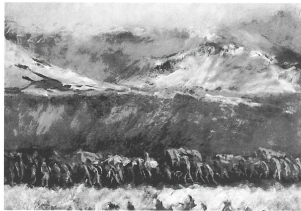
Mednyánszky: Havasok alján, 1916 körül