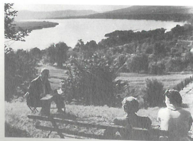
A zebegényi kert