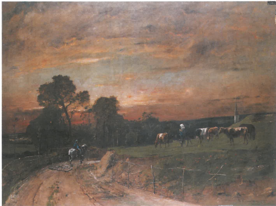
MUNKÁCSY Mihály: Hazafelé, 1882. Magyar Nemzeti Galéria, Budapest

Munkácsyval 1870 végén ismerkedtek meg Düsseldorfban és néhány hónapos ottani időzésük alatt szinte naponta találkoztak vele és Paál Lászlóval, hol a festők által