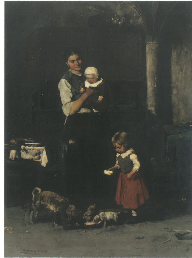
MUNKÁCSY Mihály: Két család, 1877. magántulajdon

frekvenciált Mahlkasten nevű kocsmában, hol egyik vagy másik festő műtermében. Mint a párizsi Salon aranyérmének nyertese, Munkácsy különleges figyelemben részesült ekkor Düsseldorfban és de Marche báró segítségével számíthatva kivitelezhetőnek tartotta azt a rég dédelgetett tervét, hogy a művészeti élet korabeli központjába, Párizsba költözzön.