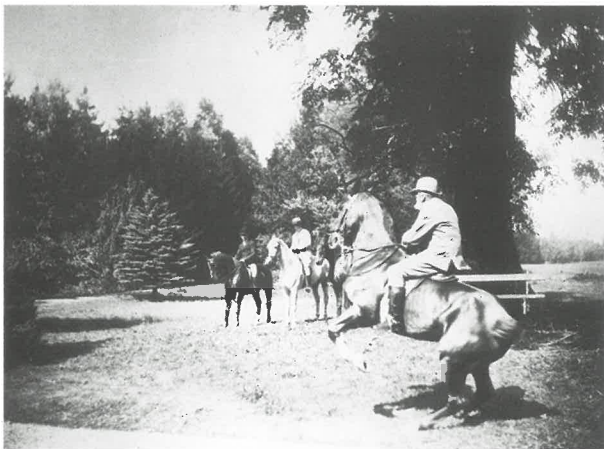
MUNKÁCSY Ióhátón a colpachi parkban