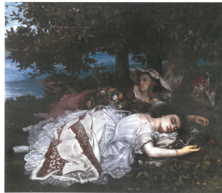
Gustave COURBET: Szajna parti kisasszonyok, 1856–1857. Petit Palais-musée des Beaux-Arts de la Ville de Paris, Párizs

Meglepő módon 1887-ben, egymás után vagy éppen párhuzamosan festett két (de lehet, hogy három) alvó alakot ábrázoló zsánerképet. Az alvó nagyapó mellett Az alvó kisgyermek és feltehetően az Alvó nő is ebben az évben készült. Nem tudni, mi fordította figyelmét éppen ekkor az alvás motívuma felé, amely egy másik valóságba zárkózás momentumát rögzíti, egy olyan élethelyzetet, amelyben az alvó ember elérhetlenné válik környezete számára, és ezért bizonyos titokzatosság övezi. Az alvó ember személyisége megszűnik, így az egy vagy több alvó figurát megjelenítő életképek csendéletként viselkednek, lehetővé téve a néző zavartalan elmélyedését a kép témájában. Munkácsy említett képei közül ilyen az alvó gyermeket és az