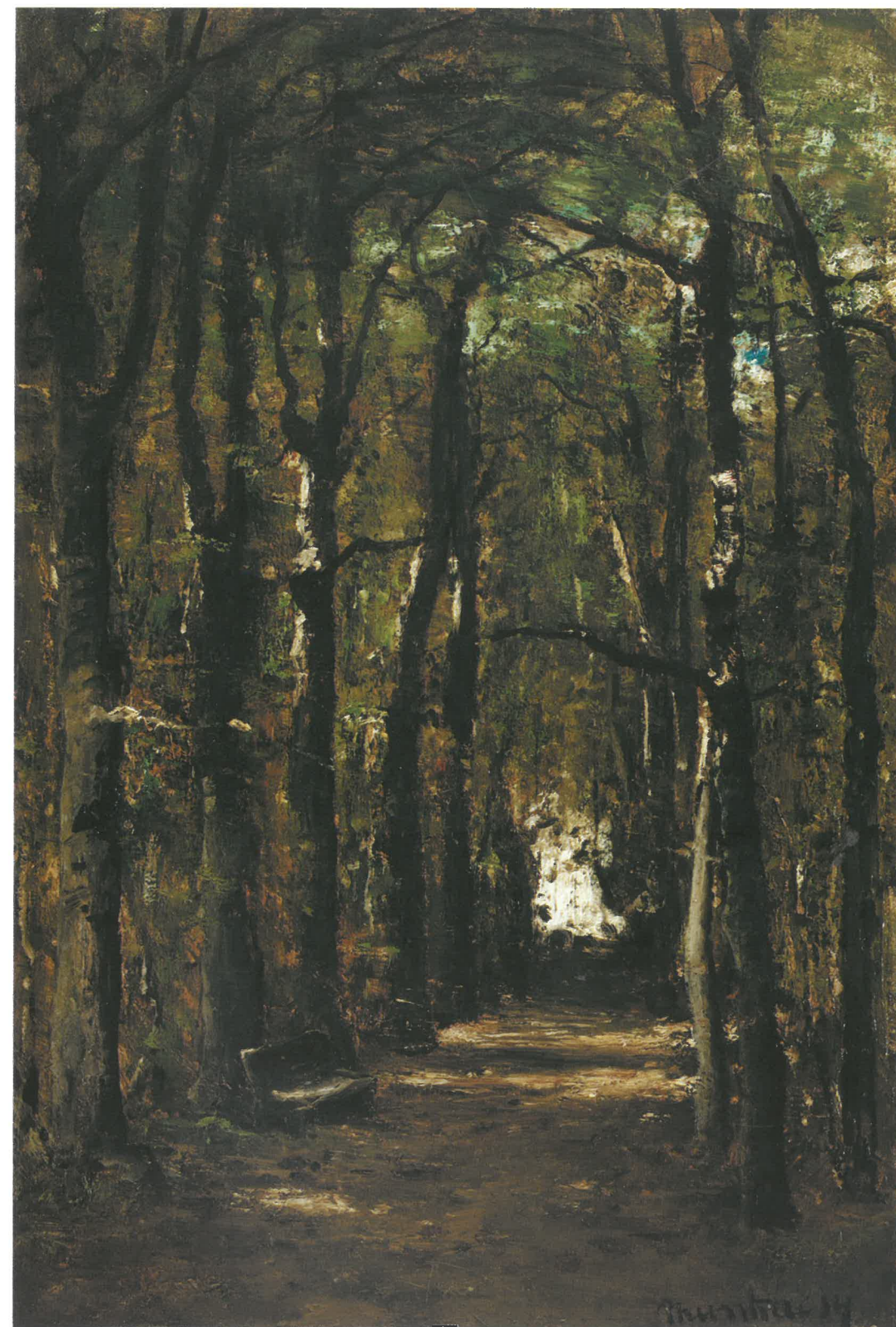
MUNKÁCSY Mihály: Fasor (Colpachi park), 1873. magántulajdon

A családi legendárium úgy tartja, hogy de Marche báró egy délutáni sétakocsikázás alkalmával hallotta meg Cécile-t énekelni és ezüstösen csengő friss hangjába nyomban beleszeretett. Más források szerint a találkozás kevésbé romantikus körülmények között történt, de tény, hogy a húszéves Cécile erőteljes, kicsattanó személyisége olyan mély benyomást tett a báróra, hogy családja ellenkezését legyőzve, pontosabban kicselezve (felvette a luxemburgi állampolgárságot, hogy a házasságkötés minden nyilvánosság kizárásával, titokban megtörténhessen) 1865. július 9-én feleségül vette. A házassággal szemben azonban nem csak az arisztokrata oldal támasztott akadályokat, hanem Cécile szülei is, akik cseppet sem örültek a léha életviteléről közismert, lányuknál 25 évvel idősebb, szoronyavadász hírében álló báró házassági szándékának. Amikor Cécile előállt a házasság tervével, apja a családban szállóigeként fennmaradt „ Pas de mariage, pas de voyage ” (Se házasság, se utazás) felkiáltással fejezte ki ellenérzését.