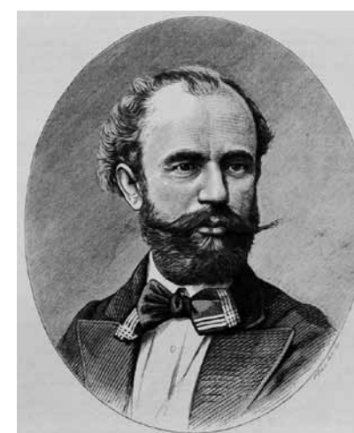
2. Mészöly Géza portréja Pollák Zsigmond metszete