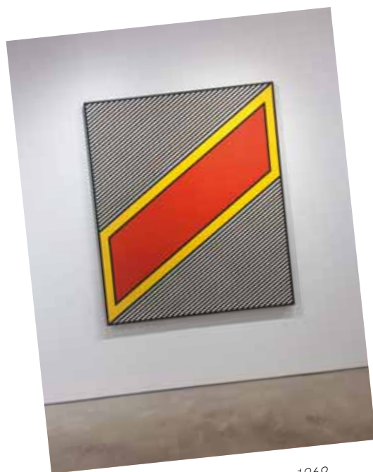
2. Nicholas Krushenick: Silver liner, 1969 Garth Greenan Gallery, New York

Nádlér István hetvenes években készült műveinek két főszereplője az ún. csavart- és a pasztikus-átló. De miért pont e két geometrikus elem érdekelte Nádlert?