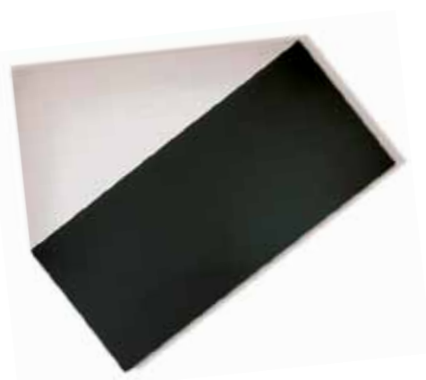
1. Ellsworth Kelly: Fehér háromszög feketével, 1976 magángyűjtemény