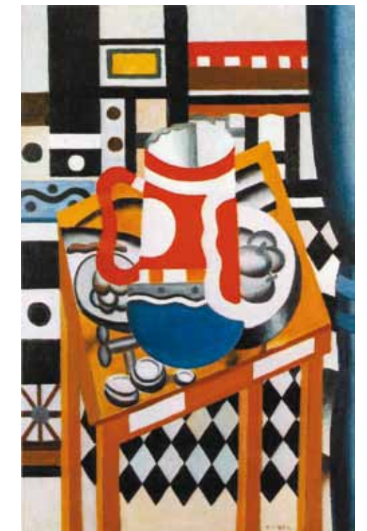
7. Fernand Léger: Csendélet söröskorsóval, 1921 Tate, London