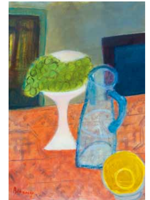
6. Berény Róbert: Kancsós csendélet, 1928 körül magántulajdon