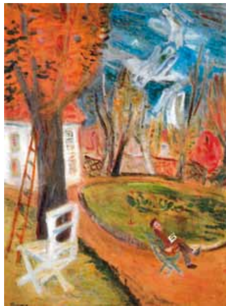
Ámos Imre: Álom a Luxembourg kertben