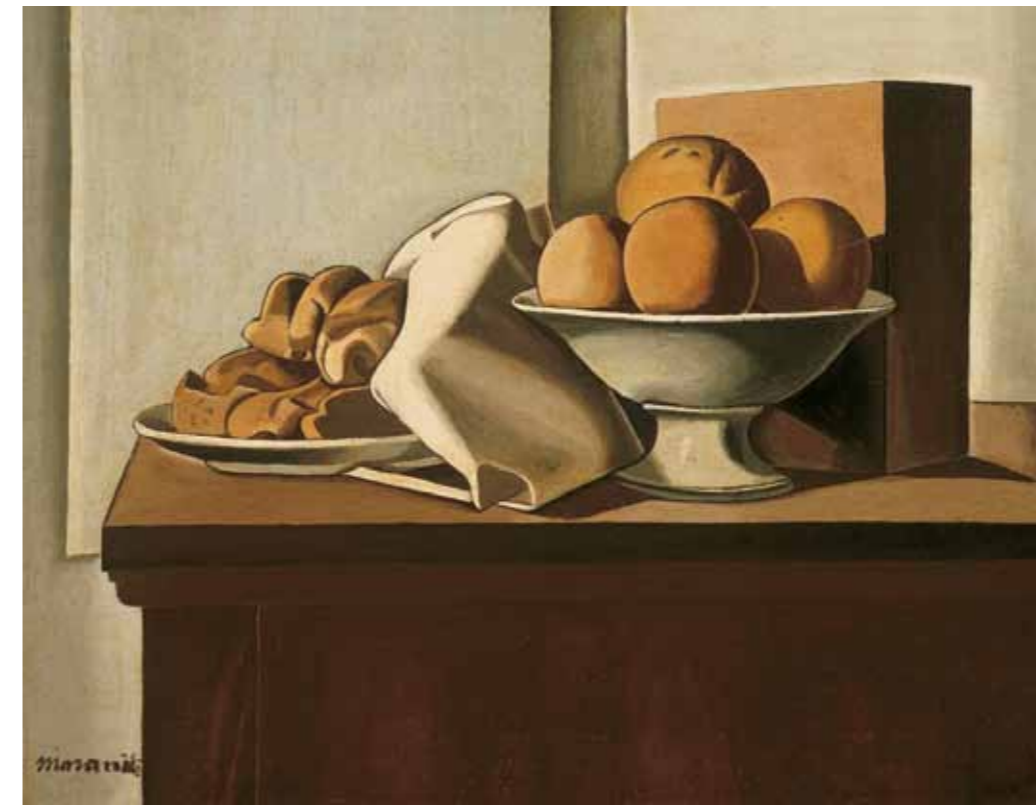
3. Giorgio Morandi: Csendélet, 1919 magántulajdon