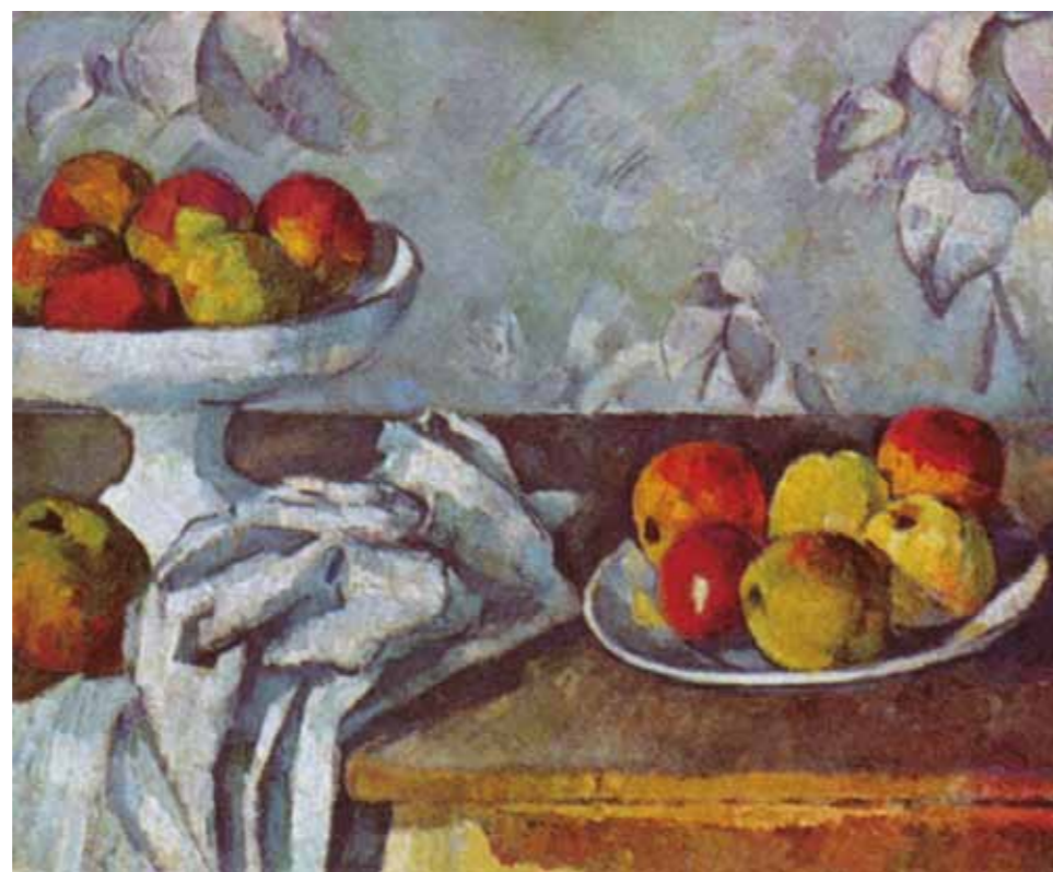
2. Paul Cézanne: Csendélet almákkal, 1882