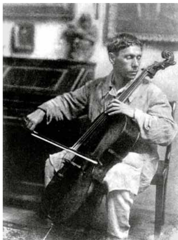
1. Czigány Dezső gordonkázik, 1920 körül