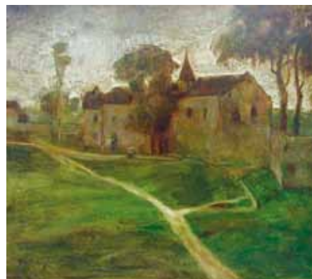
Gulácsy Lajos: Zárda környéke, 1905 előtt, magántulajdon