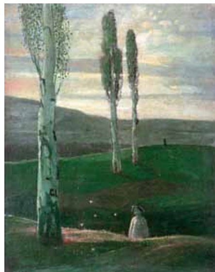
Gulácsy Lajos: Tavasz a Campagnán, 1903-1904, Hermann Ottó Múzeum, Miskolc