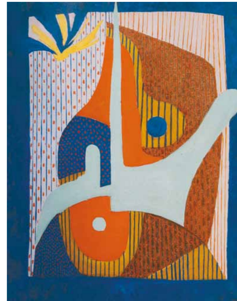
3. Tihanyi Lajos: Absztrakt festmény, 1933 Magyar Nemzeti Galéria, Budapest