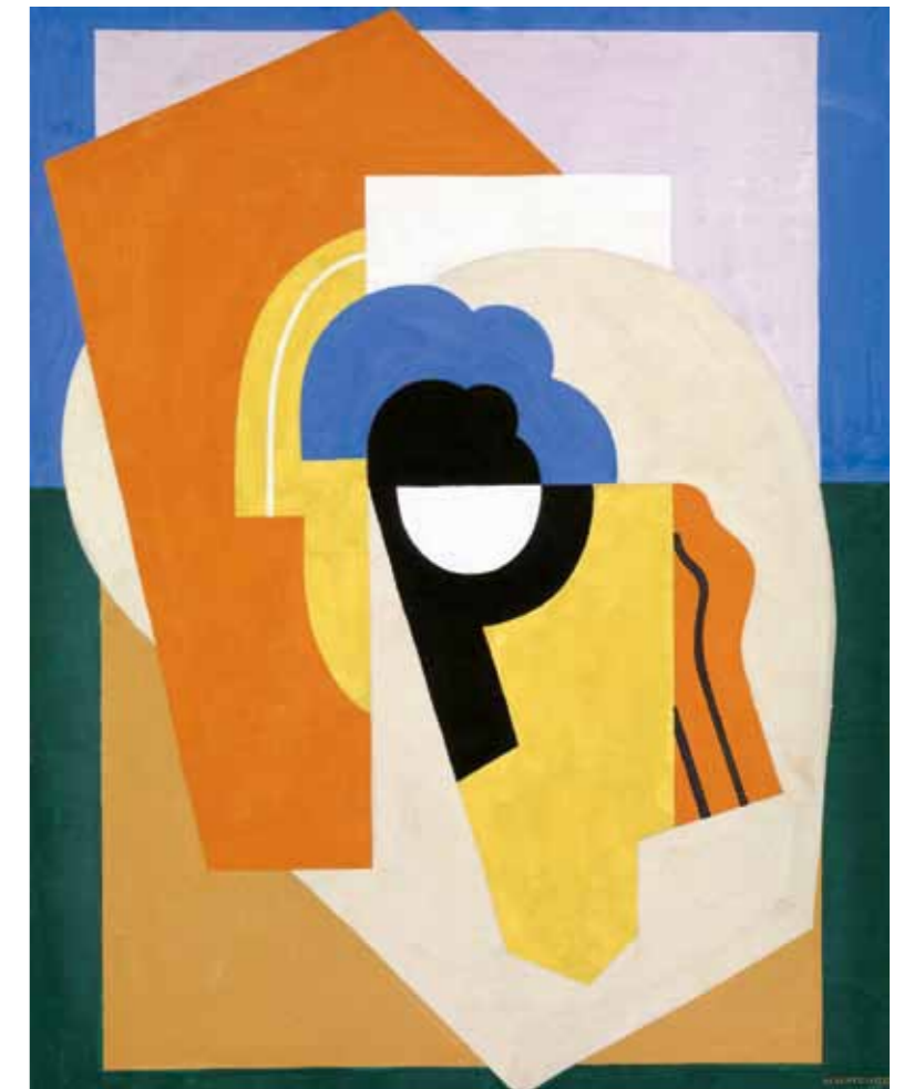
4. Albert Gleizes: Festmény, 1921 TATE Gallery, London