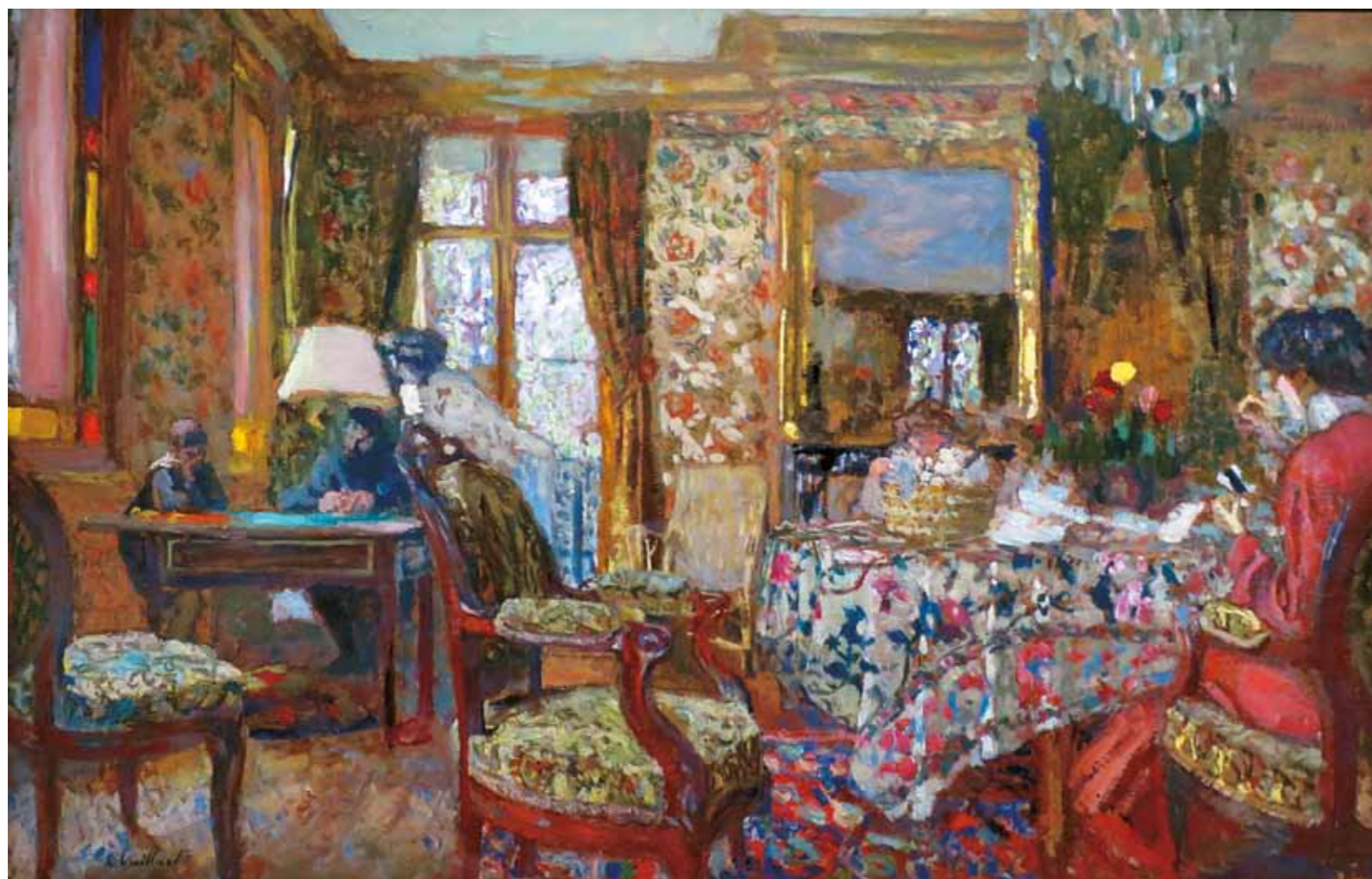
4. Édouard Vuillard: Intérieur, 1904. Puskin Múzeum, Moszkva

Ehhez a fajta esztétikához, ehhez a francia naturalizmuson átszűrt holland hagyományhoz illeszkedik az 1910-es évek Intérieur-je is, amely a rákospalotai otthon, az 1907-ben vásárolt nagypolgári villa, az egykori Vécsey-kúria nagy szalonját örökíti meg egy elegáns hölgytársasággal.