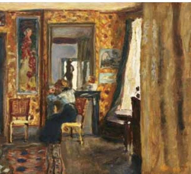
2. Pierre Bonnard: Intérieur, 1908 körül magántulajdon