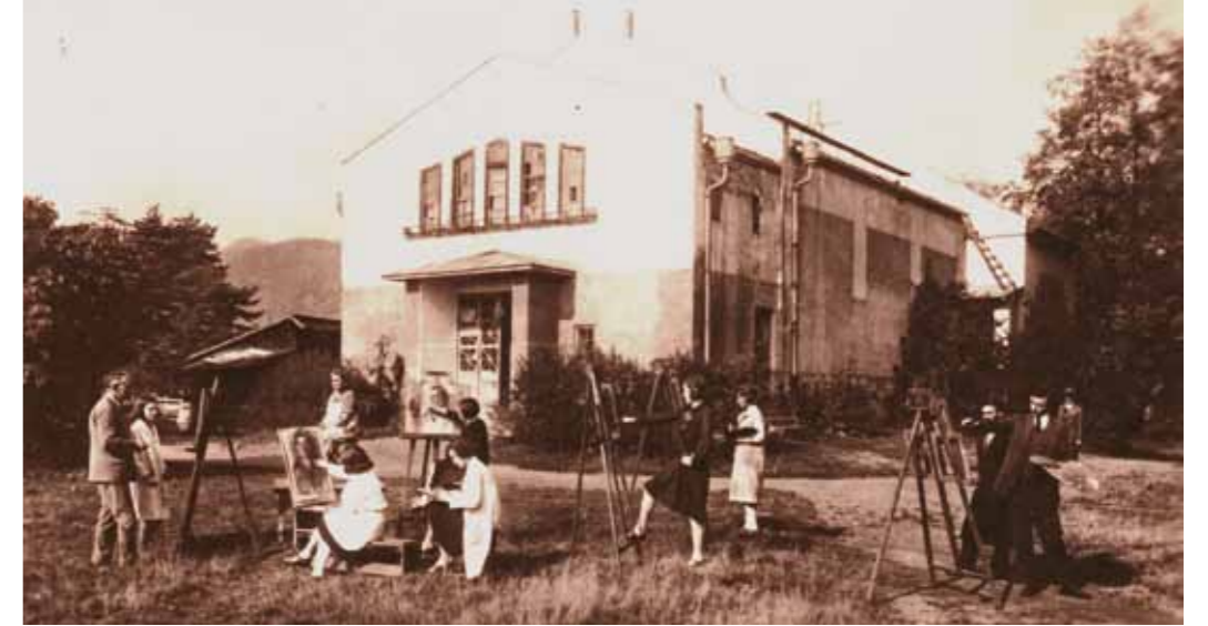
3. Festőiskola Nagybányán, 1940.