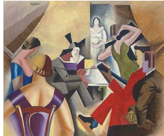
3. André Lhote: Tánc a bárban, 1920-as évek eleje magántulajdon