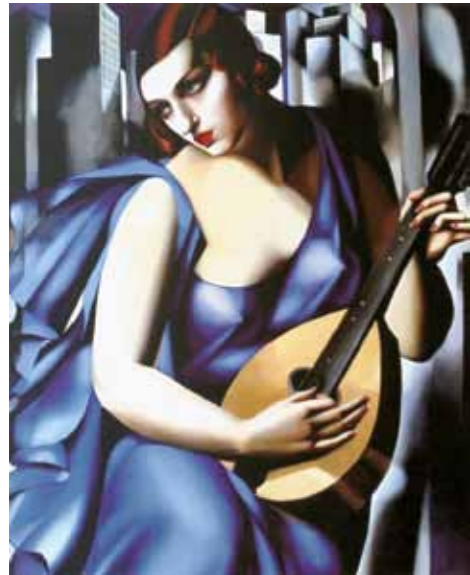
1. Tamara de Lempicka: Zenész, 1929 magántulajdon

▶ Magyar zene és kép. szerk: Kieselbach Tamás. Corvina Kiadó, Budapest, 2007. 94. oldal