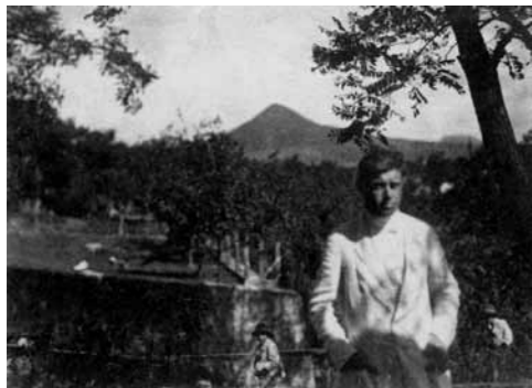
1. Tihanyi Lajos, 1917