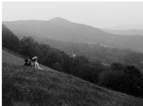
2. Budai látkép, háttérben a János-hegygel, 1900