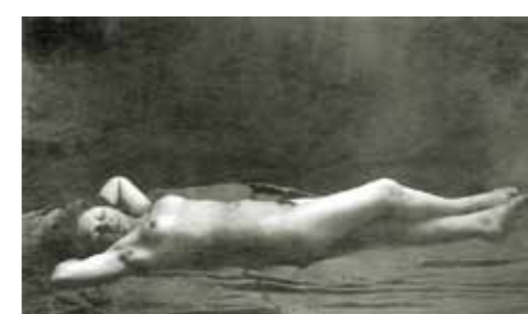
7. Pechán József: Fekvő női akt, 1912 körül (fotográfia)

a modort „stilizált naturalizmusként” határozta meg. A korábbi időszakra jellemző nagyvonalúbb, oldottabb kompozíciók Pechánnál is aprólékosabbak, részletgazdagabbak lettek, míg figuráinak beállításai az akadémia hagyományosabb típusaihoz tértek vissza. Pechán „rajzos-szállkás” modora, kiegészülve a festő dekoratív szín- és formavilágával vibráló összehatást kölcsönöz képeinek. Figurái síkszerűek, melyeket több egymást fedő rétegben, foltszerűen felhordott színekkel modellált. Sőt az erőteljesebb színhatások elérése témaválasztásában is komolyan befolyásolták a festőt: aktképeinek állandó kellékeivé válnak például azok a szöttesek, melyek fakturális szempontból is végtelenül izgalmassá teszik képeit. Munkássága során Pechán gyakran dolgozott fotók alapján, fennmaradt felvételei tanúsítják, hogy aktképeikhez is készített fotókat, és elő-