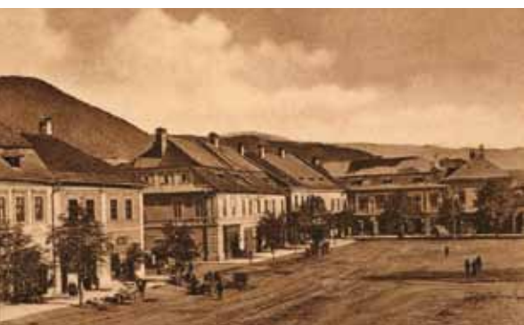
Nagybánya, 1920 körül