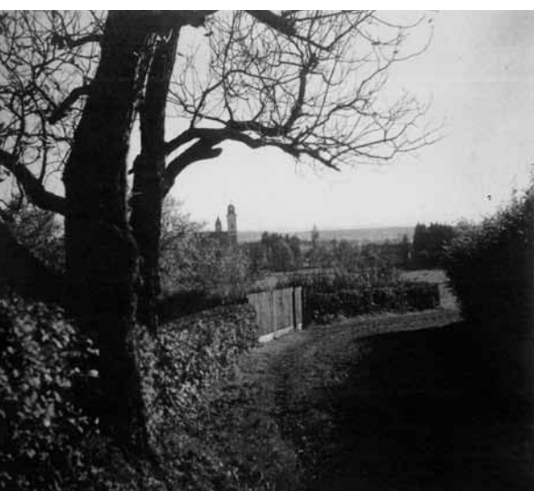
Nagybányai részlet, 1930 körül