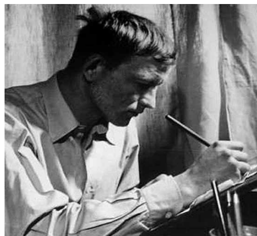
1. Kondor Béla munka közben, 1960-as évek elején

Az 1950-es évek végén, a pályája kezdetén álló Kondor Béla számára a korabeli, hazai képzőművészet két meghatározó irányzata, vagyis a kultúrpolitika által támogatott szocialista realizmus és a főiskolán uralkodó posztnagybányai, posztimpresszionista szellem egyaránt idegenül hatott. Ő mégsem az ún. „modernekhez”, hanem elsősorban a művészettörténet nagy alakjaihoz (Giotto, Dürer, Grünewald, Rembrandt, Goya) és az ortodox ikonképekhez fordult saját festői nyelvének kialakításában. Nem véletlen nevezte Németh Lajos „emberfestőnek” Kondort, hiszen a festő-barát tudatosan választott előképeiben és műveiben egyaránt egy etikai magatartást, az emberismeret és önismeret lehetőségét látta, 1 míg magában Kondorban, a 20. század nagy humanistáját. Kondor sok tekintetben meg is felelt ennek a képnek, a nagy elődökhöz mérten maga is több műfajban tevékenykedett: kiváló grafikus volt (a „rézkarc király”), verseket írt, zenélt, hangszereket készített és talált fel, illetve érdeklődött a repülőszerkezetek iránt.