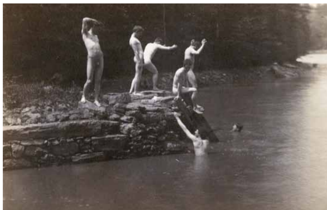
1. Thomas Eakins: Eakins tanítványai a Fürdőlyuknál, 1884 , Getty Center, Pacific Palisades, California