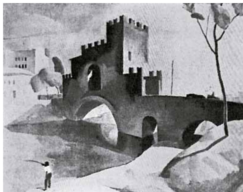
2. Patkó Károly: Ponte Nomentano, 1930 körül lappang