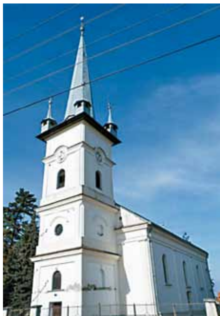
A nábrádi református templom napjainkban