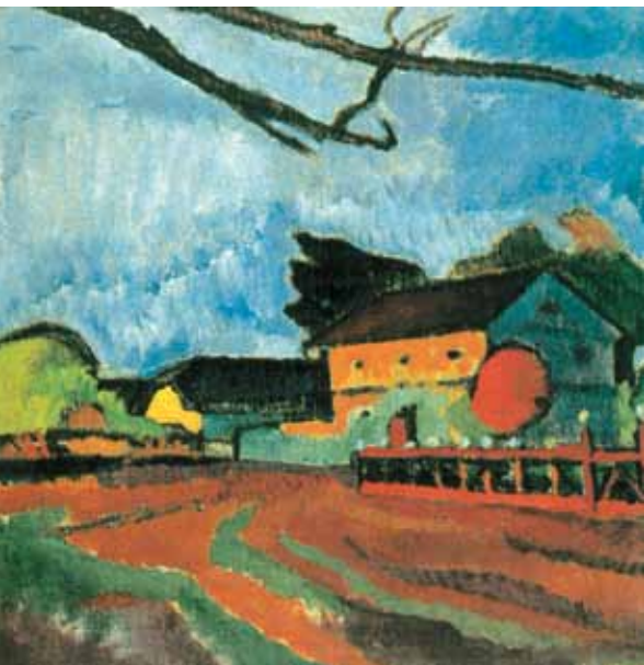
Bornemisza Géza: Falusi utca ( Falu látképe ), 1911, magántulajdon