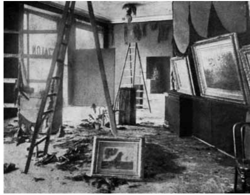
3. Paál László képei az Nemzeti Szalon 1902-es kiállításán a tűzvész követően

A holland tanulmányút köré csoportosítható tárgy-együttes tökéletesen bizonyítja, hogy Paál piktúrájának kiteljesedésében milyen óriási szerepet játszott a 17. századi németalföldi tájképfestészet. A művész két ízben is áttanulmányozta Amsterdam, Haarlem, Hága múzeumait. „Mielőtt Beilenben letelepedtek (Paál és Jettel – K.G.) végigjárták a holland múzeumokat [...] Csak Ruysdael és Hobbema intim tája értették meg velük a francia barbizoni mestereket, akikkel útközből, de már előbb Münchenben, Bécsben, műkereskedőknél itt-ott találkoztak. Csakis ilyen benyomásokkal