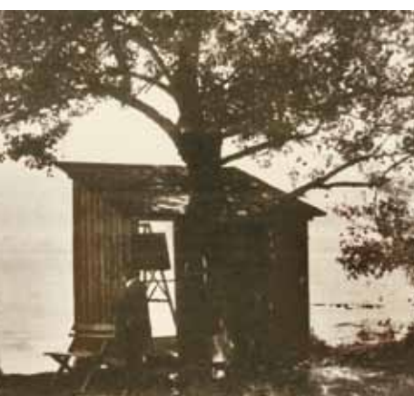
Szinyei Merse Pál a fonyódi festőkabin előtt 1917-ben