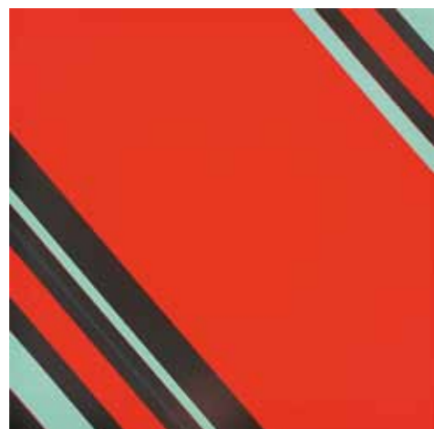
2. Günter Fruhtrunk: Érzelm/Suprematizmus (Hommage à Malevich II.), 1973. magántulajdon