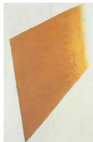
1. Kazimir Malevics: Sárga paralelogramma fehér alapon, 1917-1918. Stedelijk Museum, Amszterdam