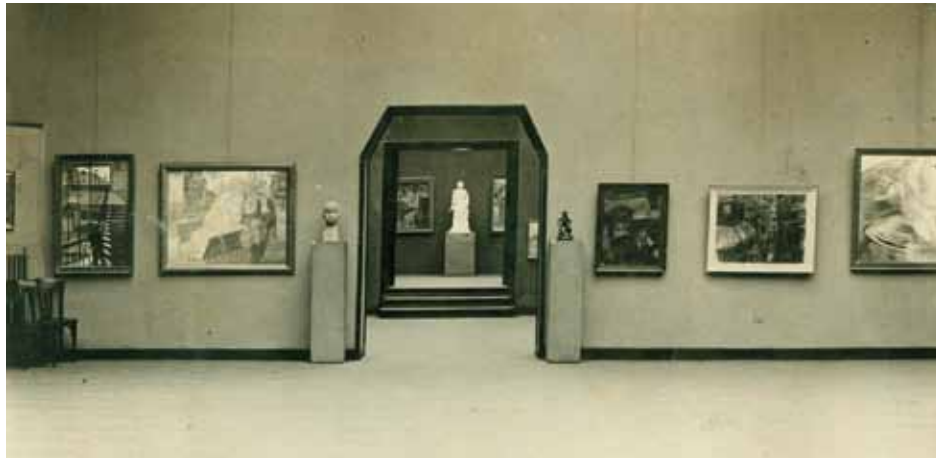
A KUT 1936-os kiállításának enteriorképe Egrý József: Szél című alkotásával. Nemzeti Szalon, Budapest, MTA BTK Művészettörténeti Intézet Adattár: MDK-C-I-5-9936-1936 KUT kiallitas-1