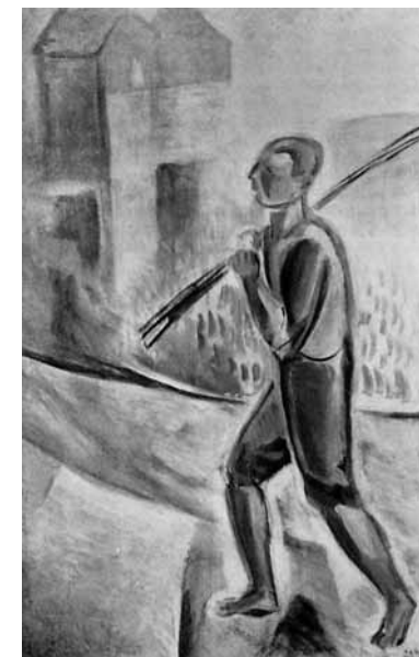
Egry József: A halász, 1936 körül Janus Pannonius Múzeum, Pécs