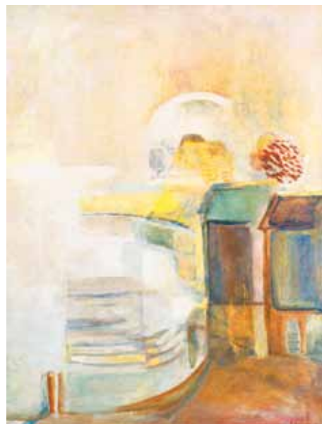
Egry József: Őszi nap, 1936 körül magántulajdon